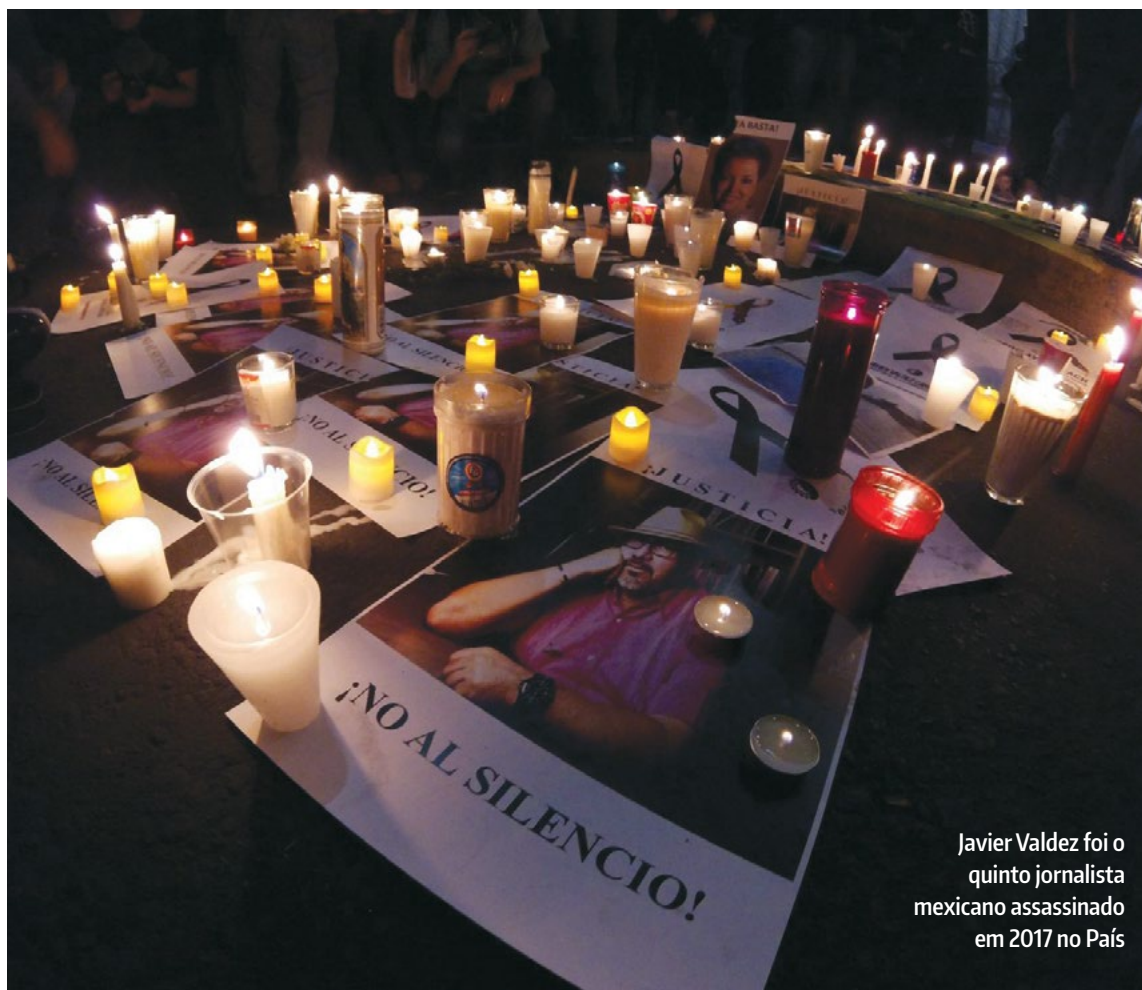
Javier Valdez foi o quinto jornalista mexicano assassinado em 2017 no País

Além disso, continuam há muitos anos os sequestros, agressões e desaparecimentos de profissionais da informação, segundo a RSF, que atribui esta violência ao fato de que “a impunidade é infelizmente a regra” e à convivência entre o crime organizado e “certas autoridades políticas e administrativas.”