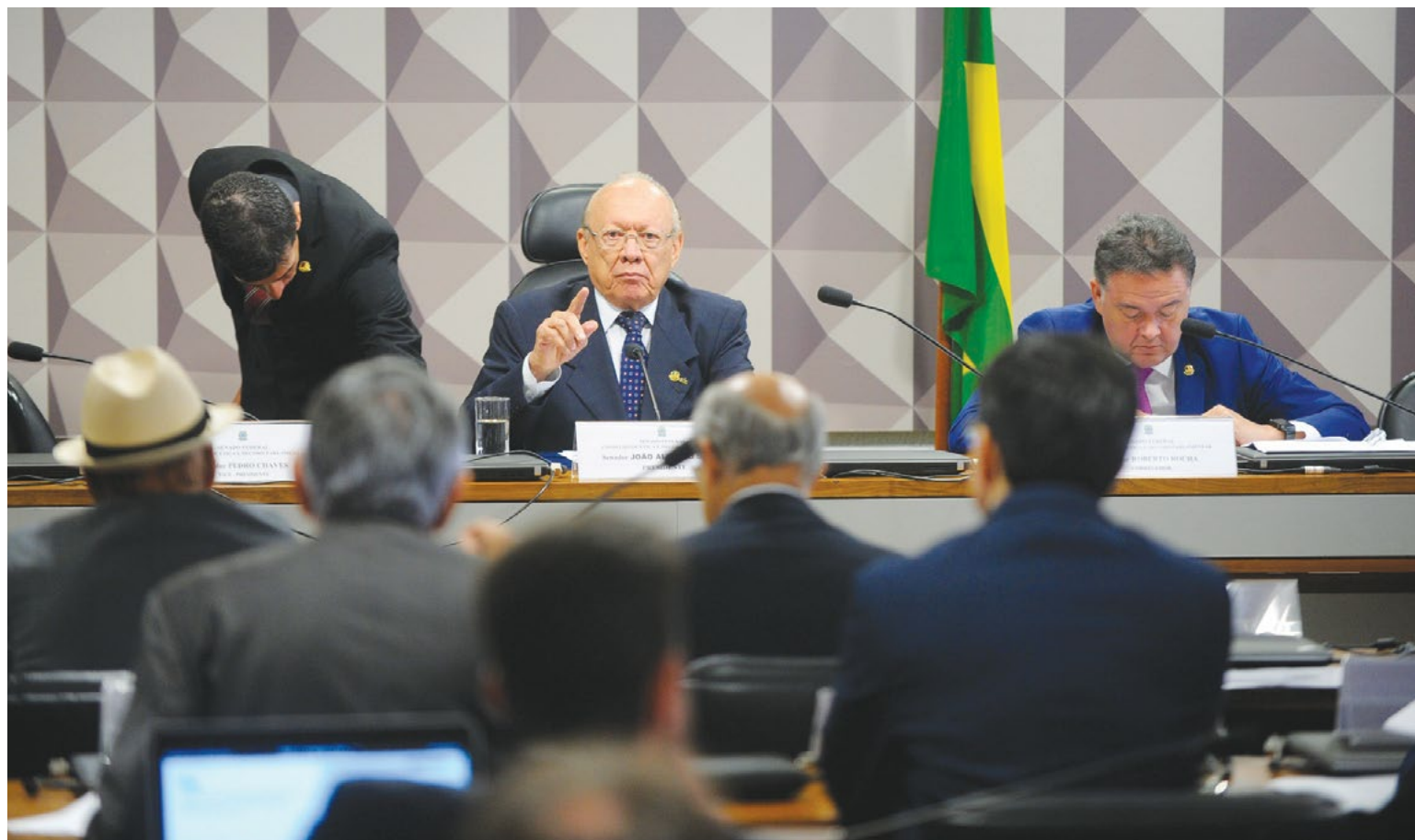
Conselho de Ética e Decoro Parlamentar em reunião que arquivou processo contra Aécio Neves, em decisão que não cabe recurso ao Plenário do Senado

Para o líder da Rede, senador Randolfe Rodrigues (AP), o resultado contraria as decisões tomadas nos últimos anos pelo conselho, que já decidiu pela cassação do ex-senador Delcídio do Amaral, em 2016. "Eu acho que hoje o instituto da ética e do decoro parlamentar