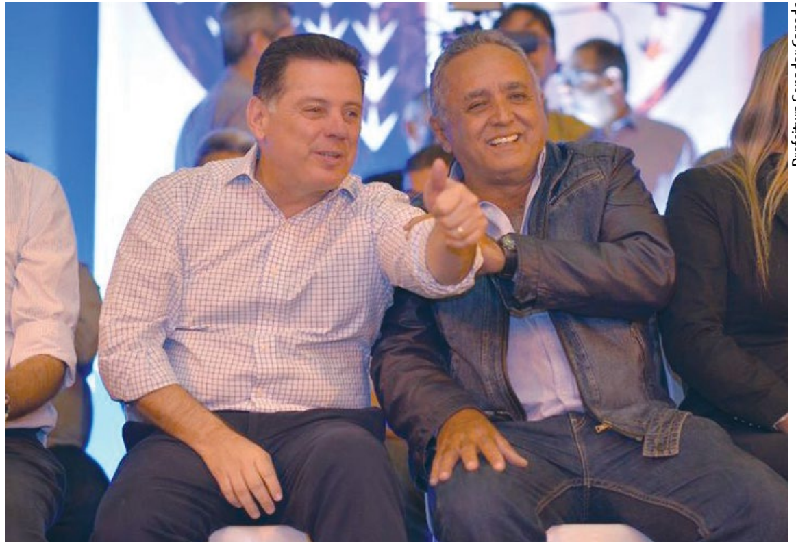
Prefeitura Senador Canedo

Coordenador-geral do programa Goiás na Frente, o vice-governador José Eliton reforçou o que tem falado nos municípios por onde passa, que trata-se do maior programa de investimentos do Brasil, sem precedentes na história de Goiás. “O programa visa estabelecer parâmetros e perspectivas para o crescimento e o desenvolvimento social”, reforçou, ao enfatizar que neste momento de crise econômica, os municípios necessitam muito do apoio