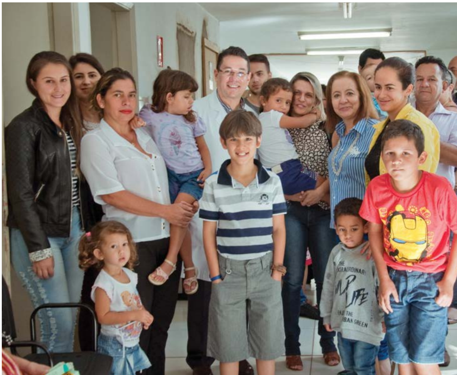
Prefeitura de Anápolis

to extra para o município, já que os hospitais recebem os valores de acordo com o que já é pactuado com o SUS. Os principais parceiros são a Santa Casa da Misericórdia de Anápolis, o Hospital Evangélico Goiano, além do Hospital Municipal.