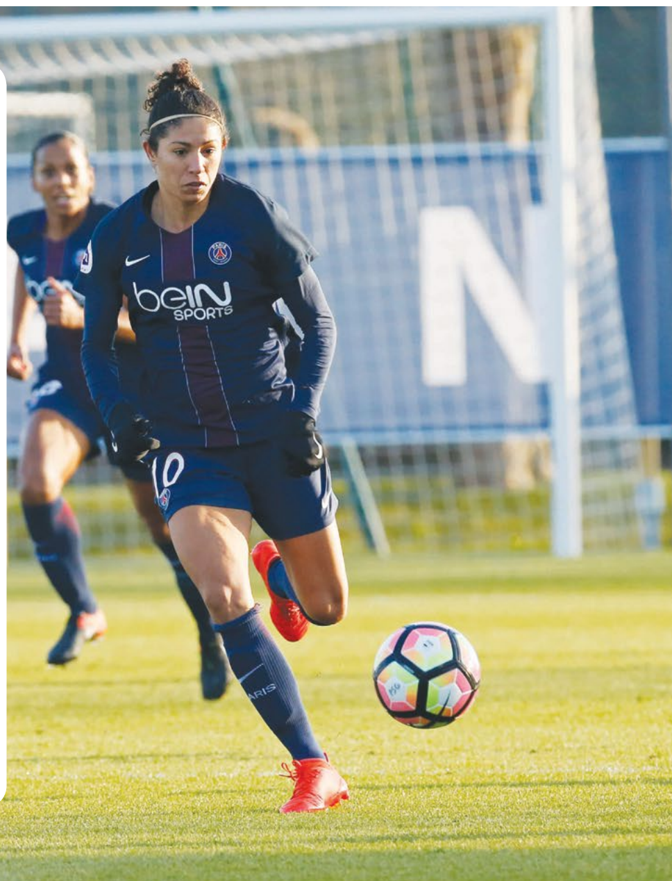
Paris Saint German

“Hoje se inicia mais um ciclo em minha vida. Um ciclo novo nesse país que para mim será uma alegria em poder morar e conhecer sua cultura. Tive uma temporada incrível no PSG, talvez a melhor da minha carreira jogando fora, dei meu melhor e fui muito feliz, fiz amizades que vou levar para o resto da vida, conheci pessoas maravilhosas e tive todo apoio e carinho do clube e dos fãs. Muito obrigada por tudo...”, declarou a jogadora.