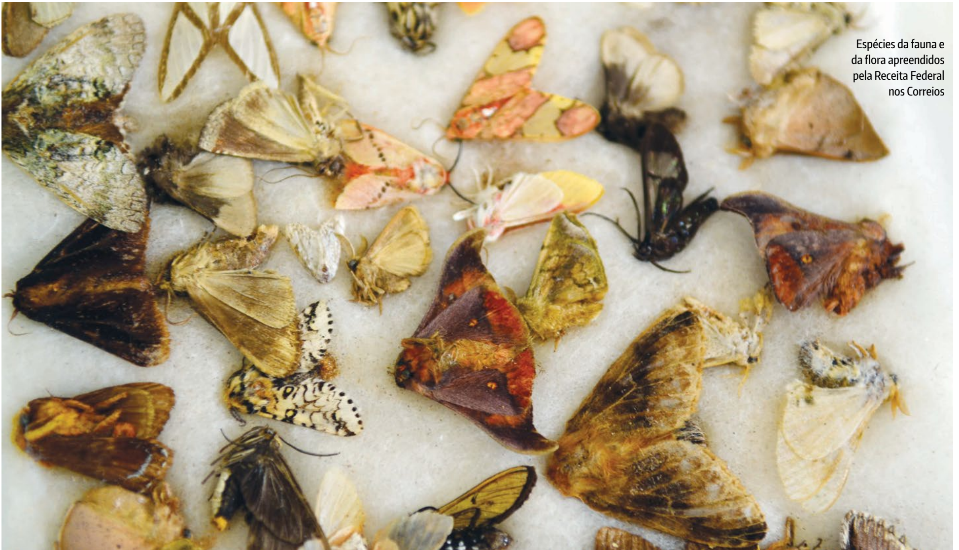
Espécies da fauna e da flora apreendidos pela Receita Federal nos Correios

E spécies da fauna e da flora silvestre apreendidos pela equipe de Fiscalização da Alfândega da Receita Federal em São Paulo foram expostos à imprensa, nos Correios na Vila Leopoldina, zona oeste de São Paulo. Os diversos materiais estavam camuflados no interior de remessas postais internacionais que declaravam apenas objetos como roupas, brinquedos entre outros.