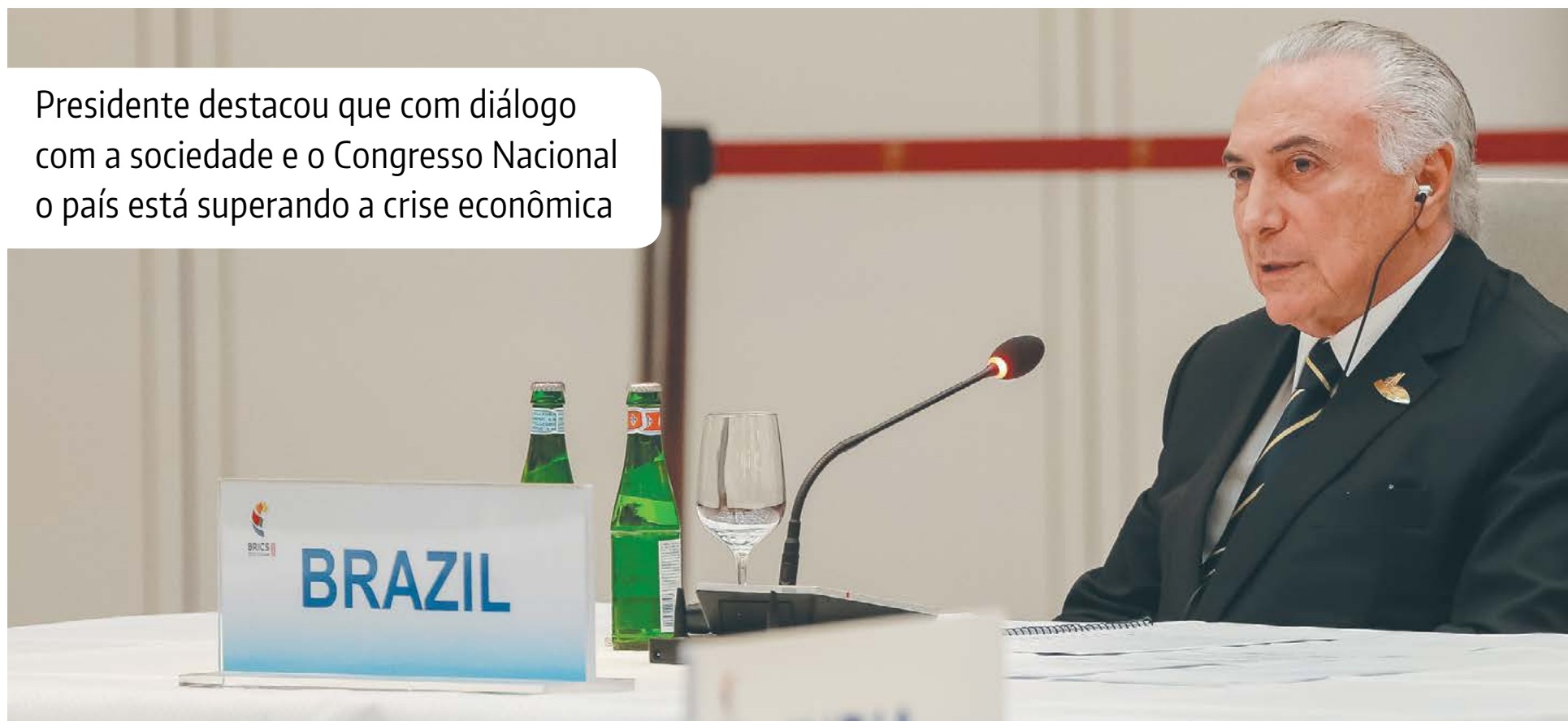
Michel Temer durante reunião dos chefes de estado e de governo dos BRICS.

Presidente destacou que com diálogo com a sociedade e o Congresso Nacional o país está superando a crise econômica