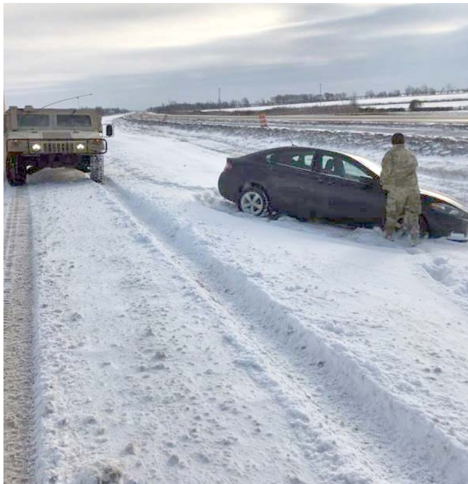
Guarda Nacional de Louisiana

Na Georgia em algumas regiões, a sensação térmica chega a menos 18°C por causa dos ventos gelados. Este já é considerado o inverno mais rigoroso nos Estados Unidos e no Canadá, das últimas décadas.