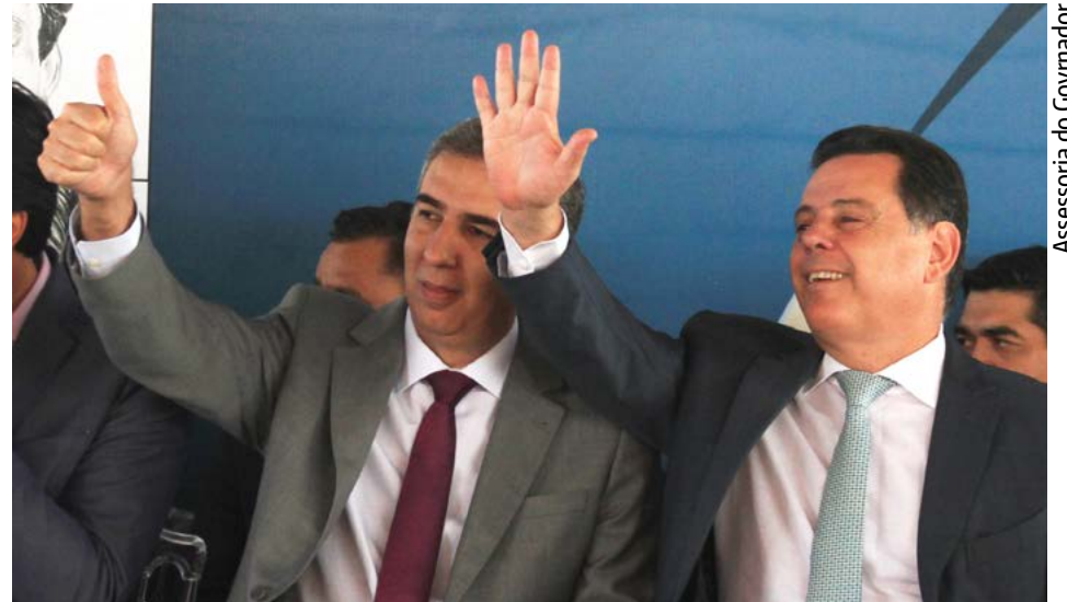
Assessoria do Governador

O Crer disponibiliza ainda exames de métodos Gráficos, além de exames de Tomografia Computadorizada, Ressonância Magnética, BERA, Mamografia e Raio X, que são todos digitaliza-