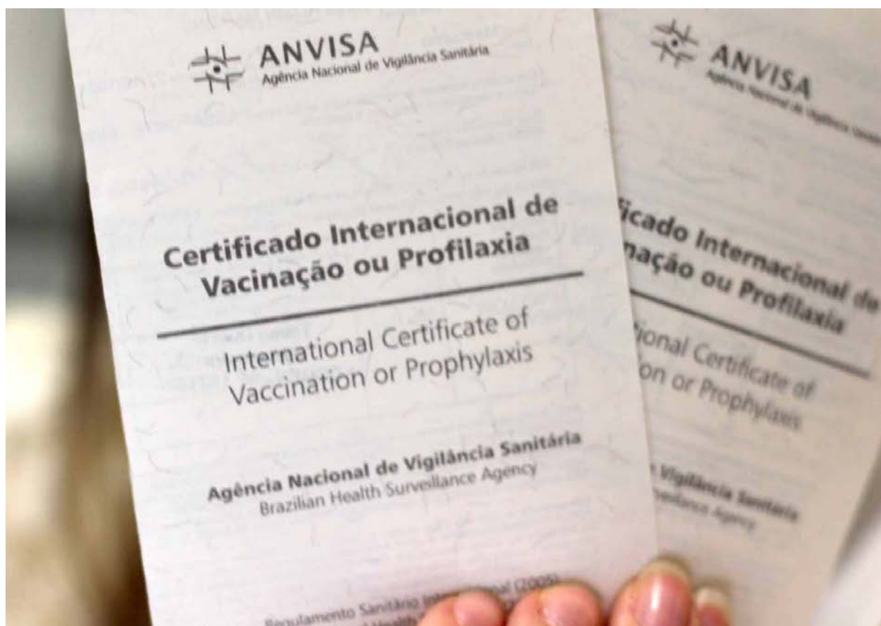
Certificado é exigido em alguns países para viagem

Os moradores dessas cidades, caso recebam a dose fracionada, mas decidam viajar a um país que exija o certificado internacional de vacina contra a febre amarela, precisam to-