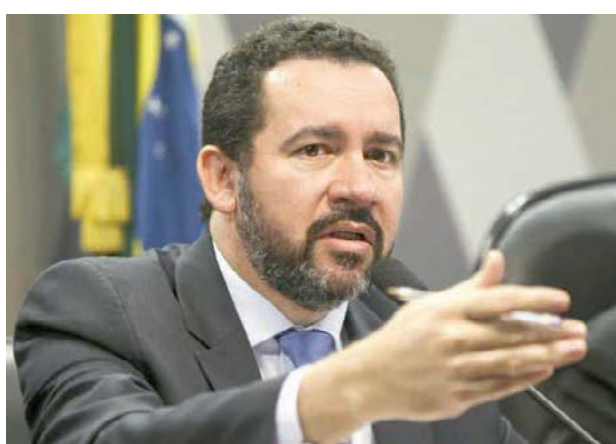
Ministro do Planejamento, Dyogo Oliveira

Introduzida pelo Artigo 167 da Constituição de 1988, a regra de ouro estabelece que o governo só pode se endividar para fazer investimentos (como obras públicas e compra de equipamentos) ou para refinarçar a dívida pública. Gastos correntes do governo federal,