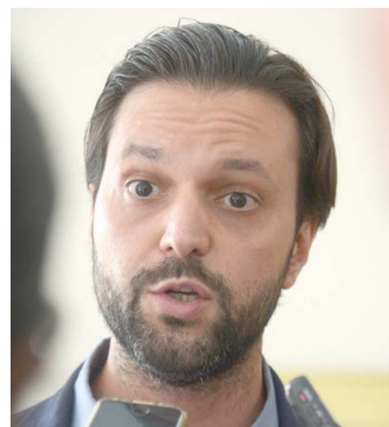
Tania Régio/Agência Brasil

Uma das possibilidades de filiação do ministro das Cidades, Alexandre Baldy, até abril, é que ela seja no PSD. A discussão estaria ocorrendo diretamente com o presidente nacional do partido, ministro Gilberto Kassab, e a direção estadual. Na hipótese de confirmação dessa filiação, Baldy (foto), em tese, poderia optar por disputar o governo estadual na eleição desse ano.