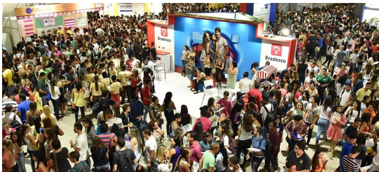
A Feira do Estudante será realizada em fevereiro de 2018, no Centro de Convenções de Goiânia

Durante a Expo CIEE Goiás 2018, os jovens poderão se candidatar a 2 mil vagas de estágio e 500 de aprendizagem. Além disso, visitarão estandes de escolas e empresas com informações exclusivas, partici-