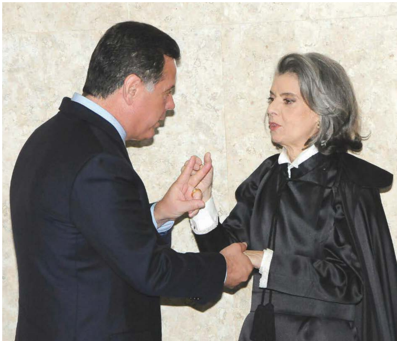
Assessoria do Governador

A declaração do magistrado provocou uma troca de notas entre o Ministério da Justiça e o governo de Goiás. A nota do Minis-