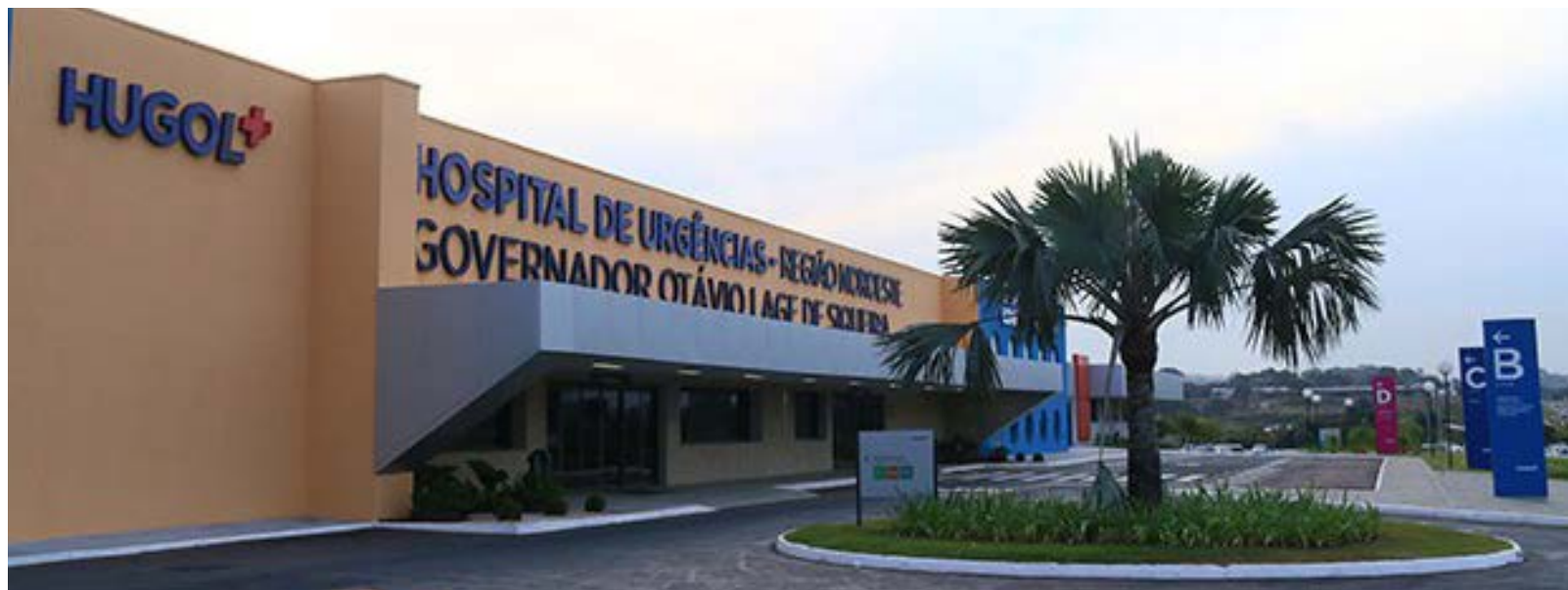
Governo de Goiás

Dos 2.042 colaboradores da unidade, 37% residem nos bairros e municípios circunvizinhos da área de abrangência da unidade de saúde. Além disso, dos 28 jovens aprendizes que trabalham no hospital, 54% são especificamente dos bairros da região Noroeste; e dos atendimentos a pacientes de Goiânia, 36% são dedicados a mo-