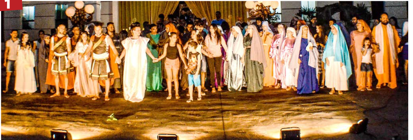
Na última sexta foi realizada na Paróquia São Francisco em Anápolis a encenação da Via-Sacra 2018, Vida, Paixão, Morte e Ressurreição de Jesus Cristo