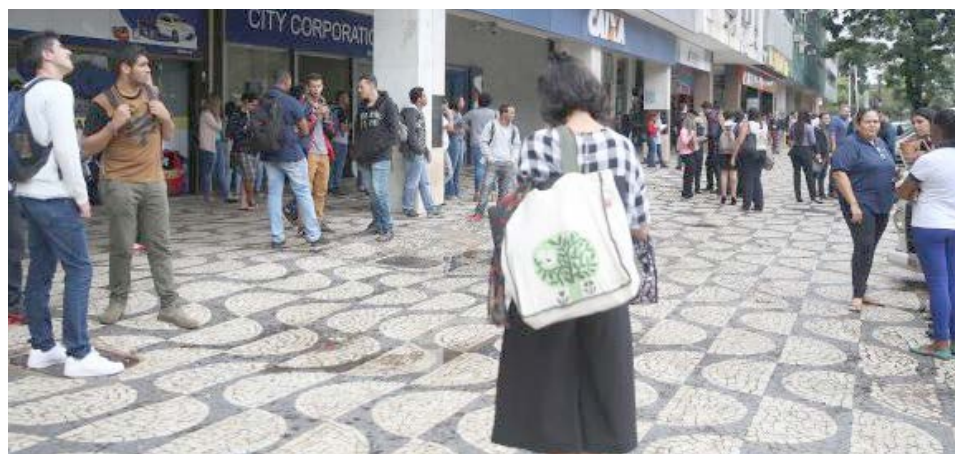
Servidores deixam prédio no Setor Comercial Sul em Brasília, após tremor de terra

“Recebemos vários chamados em todo o Plano Piloto, no Setor de Indústrias e no Guarã. Não houve nenhum relato de vítimas e nenhuma estrutura foi comprometida. Houve a percepção das pessoas quanto ao tremor, mas não se constatou nenhum problema nas edificações