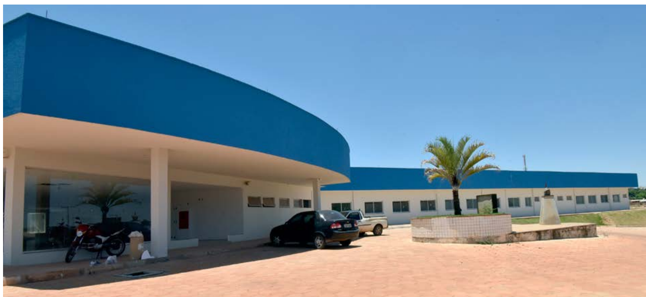
Assessoria do Governador

O Hospital Estadual de Urgências de Águas Lindas de Goiás integra a Rede de Hospitais de Urgências (Rede Hugo), cujo perfil assistencial foi definido conforme o delineamento demográfico e epidemiológico da população de abrangência. “A unidade será referência para atendimento da população da