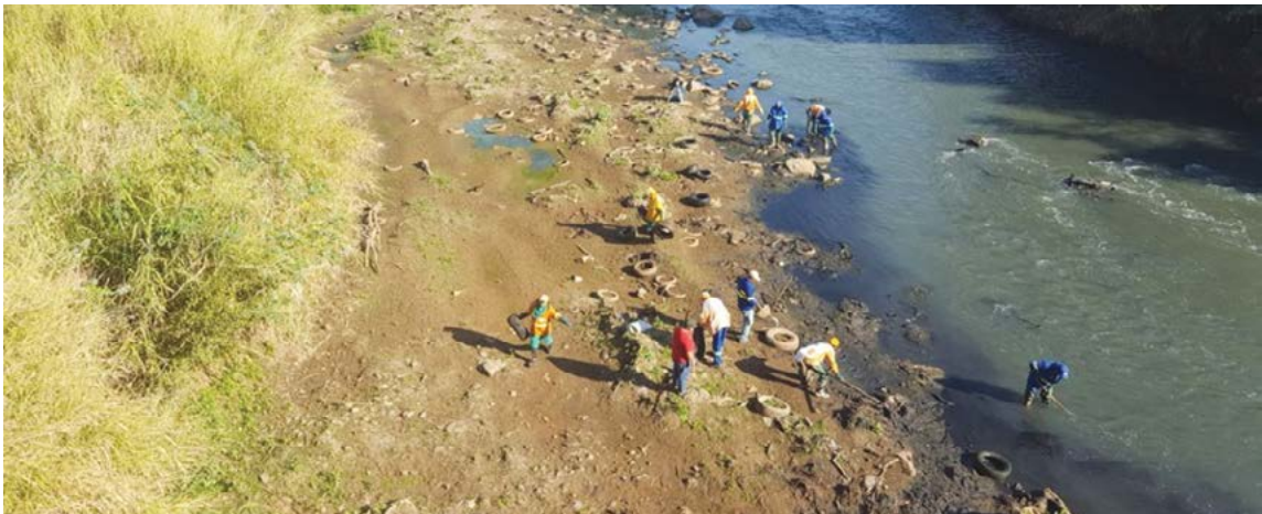
Atualmente as equipes se encontram nas imediações da Avenida José Monteiro, às margens do Rio Meia-Ponte

mais importante da Capital e do Estado de Goiás, onde se concentra a maior parte da população goiana. Neste local, os servidores já recolheram em um único dia cerca de 570 pneus, sendo 421 de carros de passeio, 53 de caminhões, 84 de motos e bicicletas e oito de tratores.