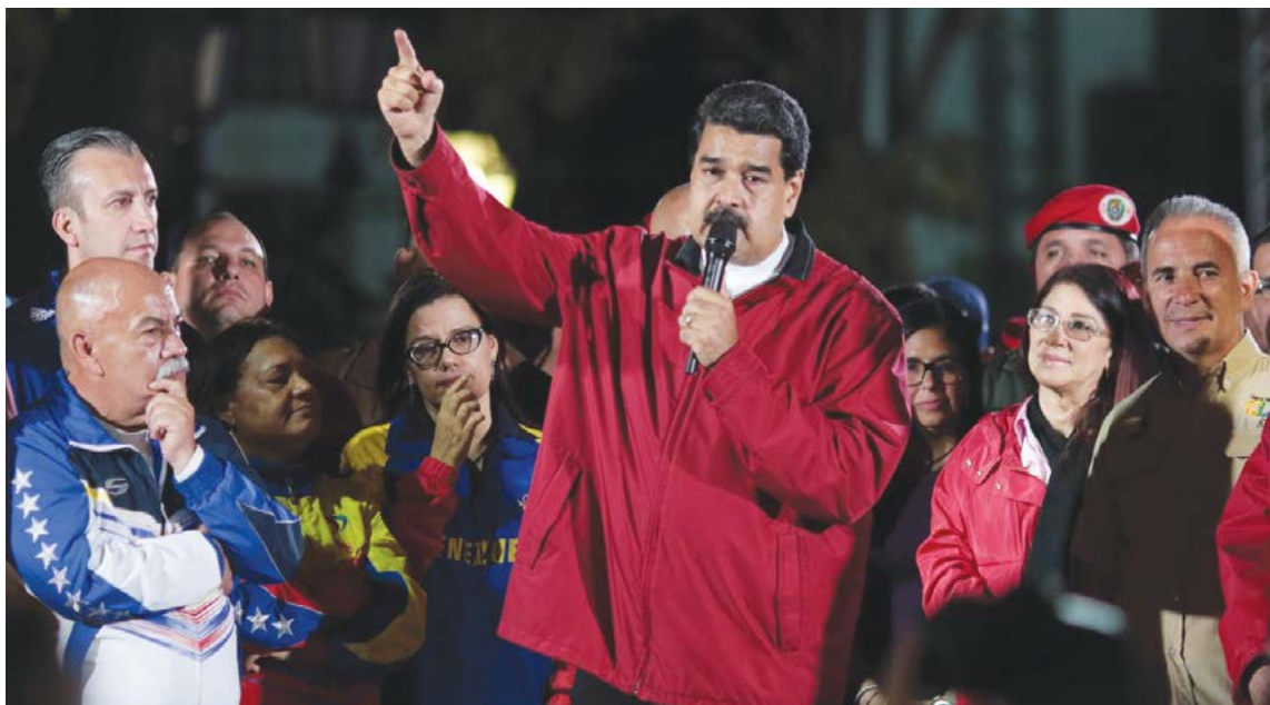
Governo da Venezuela