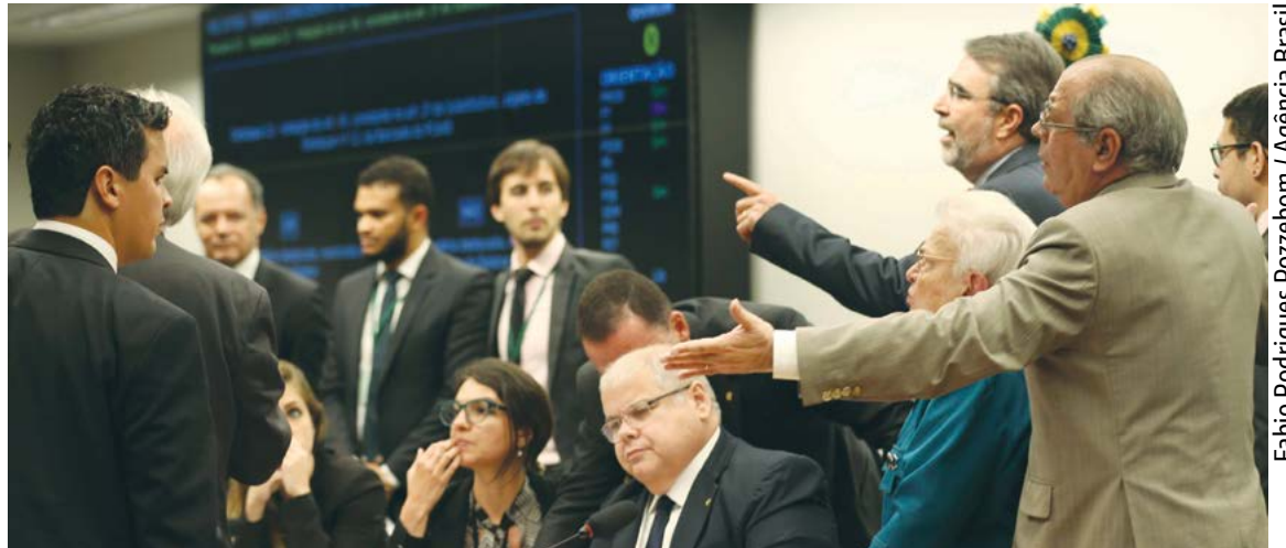
Comissão Especial da Reforma Política vota destaques do texto aprovado

A comissão retomou o processo de votação na quinta-feira passada e analisou outros desta-