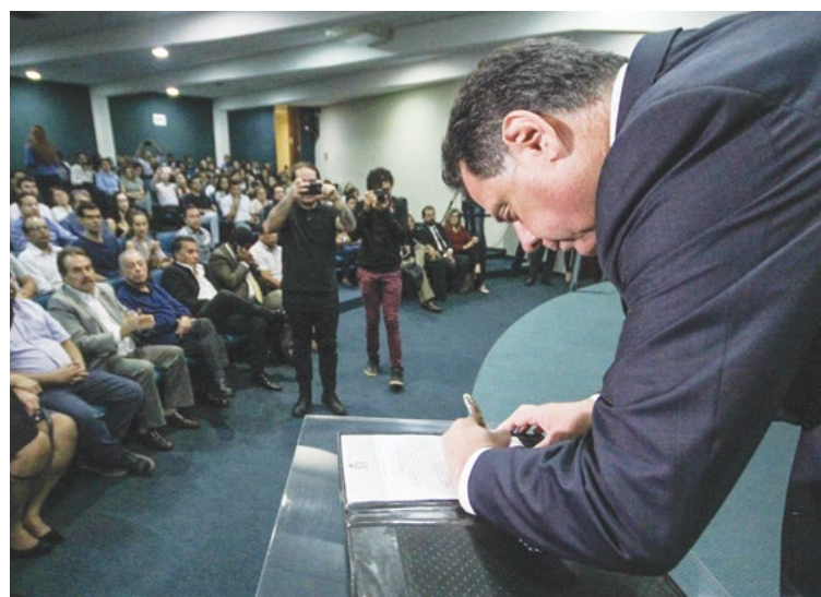
Governador Marconi Perillo empossa concursados da UEG

O concurso da UEG para preencher 247 vagas de analista de gestão administrativa e de 253 assistente de gestão administrativa foi realizado em 2015. Até o momento foram nomeados 200 aprovados, sendo que apenas 147 tomaram posse. Um total de 84 aprovados tomou posse como analista de gestão administrativa e outros 63 como assistente de gestão administrativa, de acordo com a Superintendência Central de Administração Pessoal da Segplan.