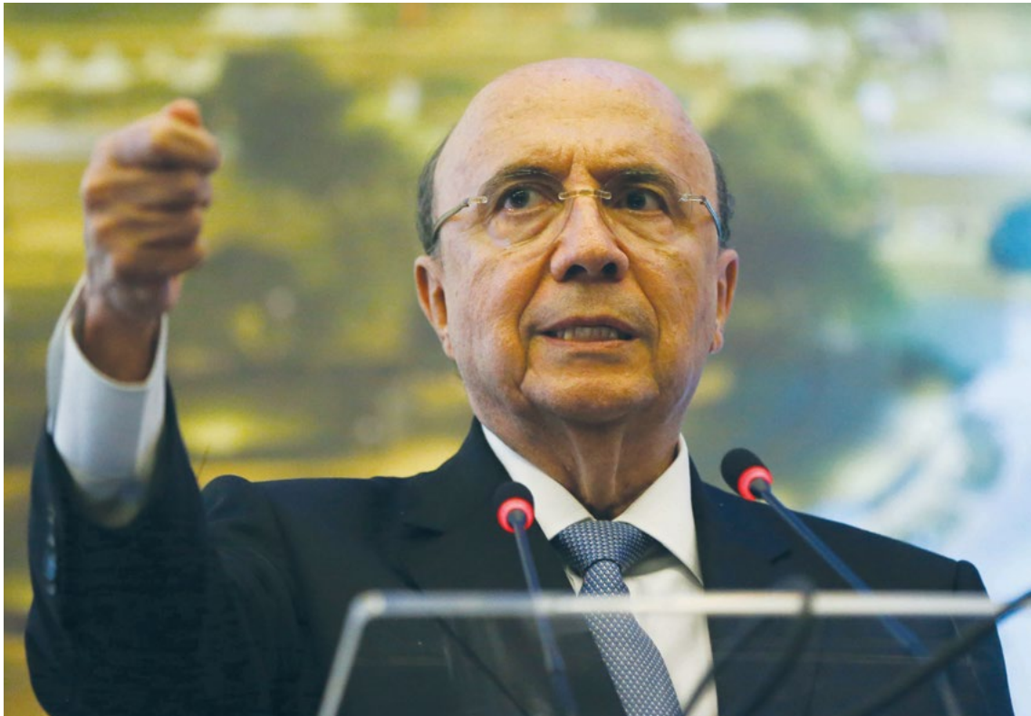
Henrique Meirelles, confirmou os estudos, porém disse que não foram trazidos para sua análise.

Depois de participar da abertura do 27º Congresso Fenabreve