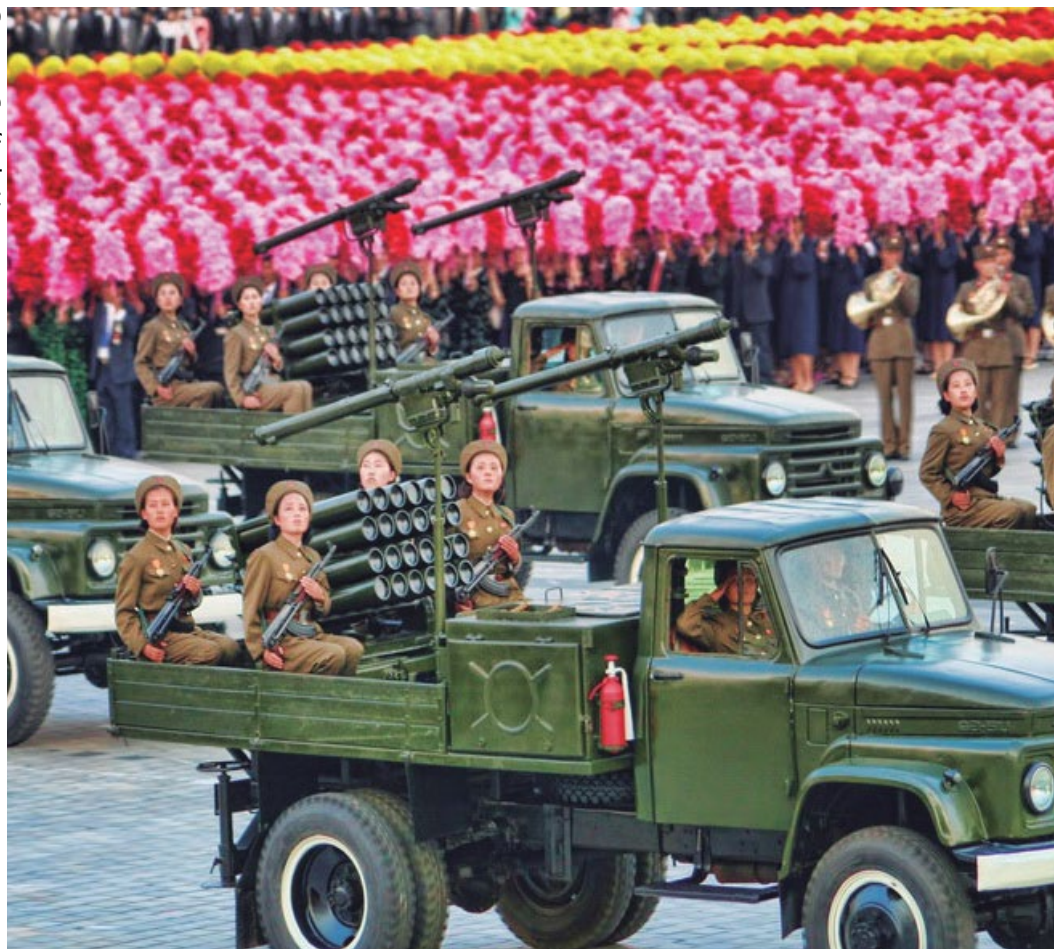
Governo Coreia do Norte

A Coreia do Norte afirmou na última quarta-feira (9), que está estudando “cuidadosamente” a possibilidade de realizar um ataque com mísseis sobre o território dos Estados Unidos de Guam, no Oceano Pacífico. O anúncio foi feito como reação à afirmação do presidente Donald Trump que, antes disso, afirmou que os Estados Unidos responderiam com “fogo e fúria” a qualquer ameaça.