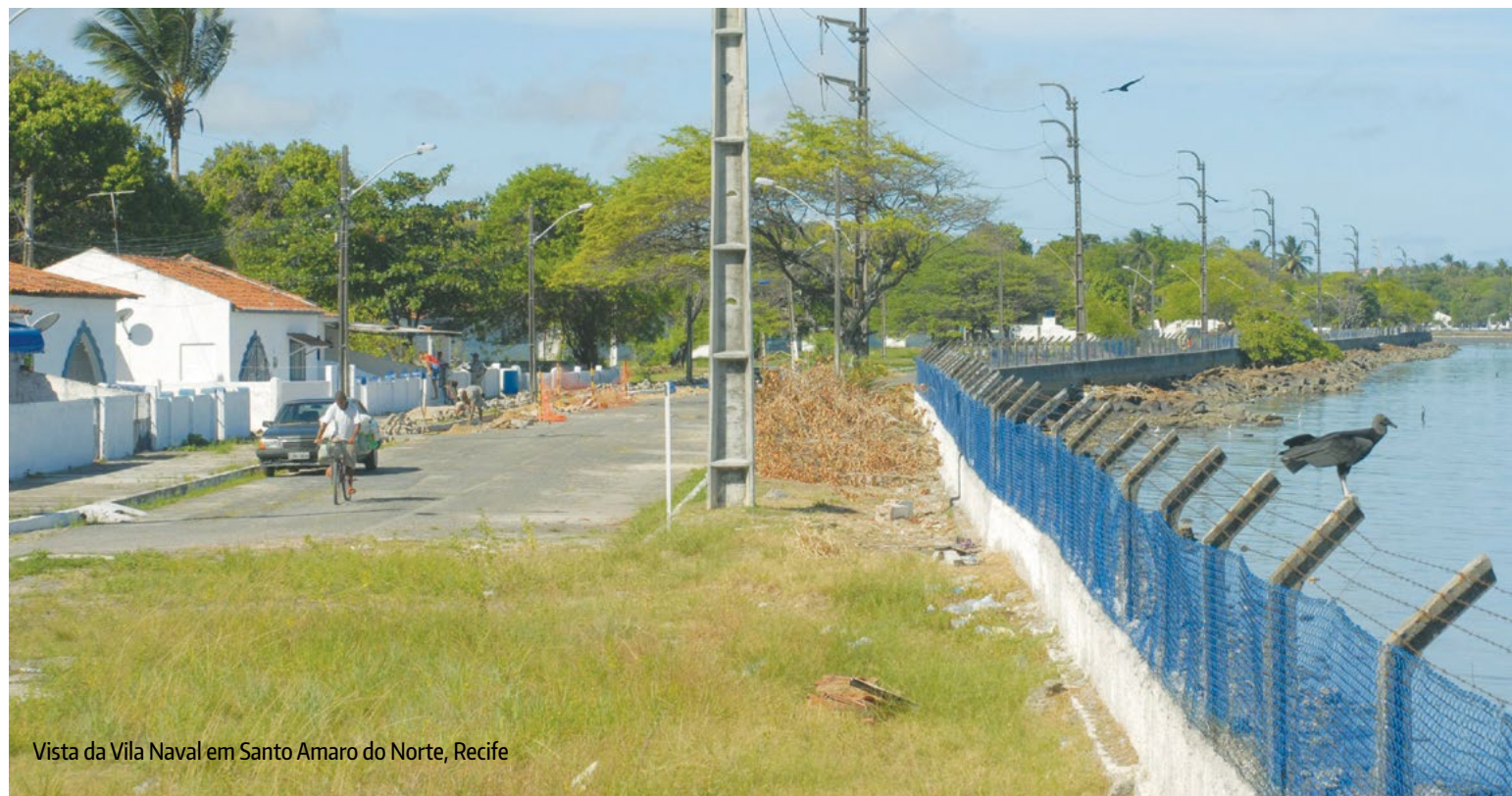
Vista da Vila Naval em Santo Amaro do Norte, Recife