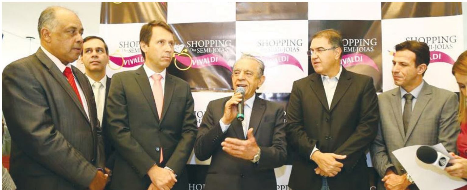
Iris Rezende durante inauguração do primeiro Shopping de semijoias do Centro-Oeste, na Avenida Bernardo Sayão

D urante inauguração de um shopping na manhã da última quarta-feira (9), no Setor Marechal Rondon, região Central de Goiânia, o prefeito Iris Rezende anunciou a revitalização da Avenida Bernardo Sayão e do bairro de Campinas. Em julho passado, a administração municipal criou uma Comissão Especial de Trabalho para discutir junto com moradores e comerciantes da região o melhor projeto que atende aos dois grandes polos empresariais da Capital. "Estamos projetando aqui, por exemplo, na Bernardo Sayão, algo que supre a falta de espaços para acomodação de ônibus e que proporcione mais comodidade aos