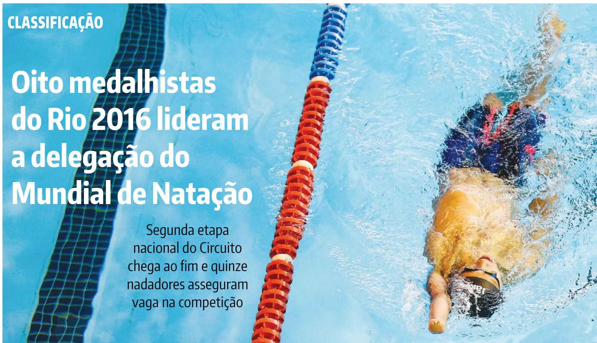
Marco Antonio Teixeira/CPB

Segunda etapa nacional do Circuito chega ao fim e quinze nadadores asseguram vaga na competição