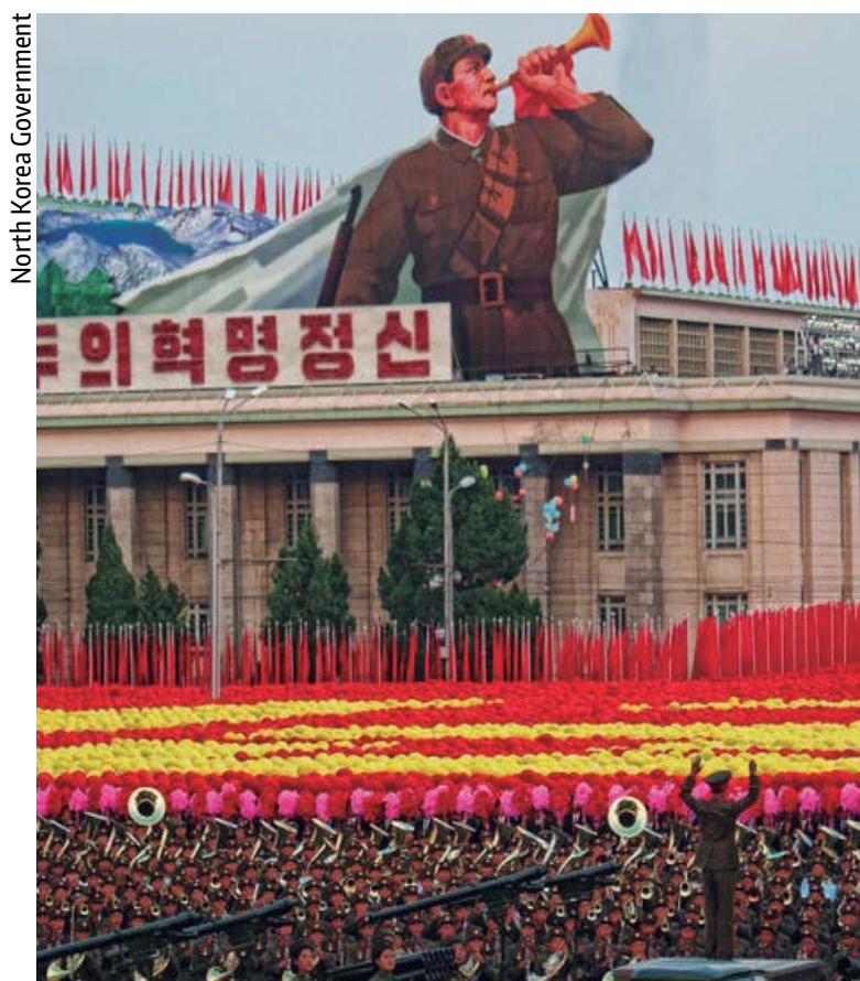
North Korea Government

“Faremos uma ação justa e decisiva (contra os Estados Unidos) tal e como já advertimos”, diz o texto. Os 15 países do Conselho de Segurança adotaram, por unanimidade, no último sábado, a resolução que levou um mês de negociações e resultou em sanções que representam US$ 1 bilhão.