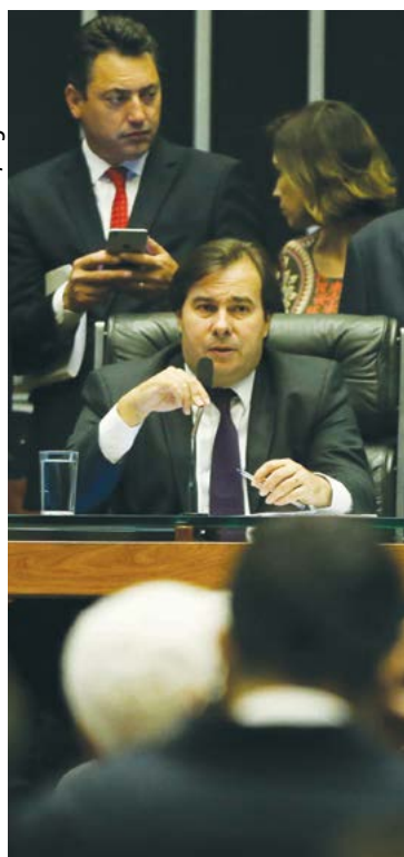
Antonio Cruz / Agência Brasil

A última contabilidade feita pela liderança governista, logo após a aprovação do parecer na comissão especial, apresentava o número de 290 votos favoráveis à reforma. No entanto, na votação em plenário do parecer que pedia o arquivamento da denúncia contra o presidente Michel Temer, o governo teve o apoio de 263 deputados.