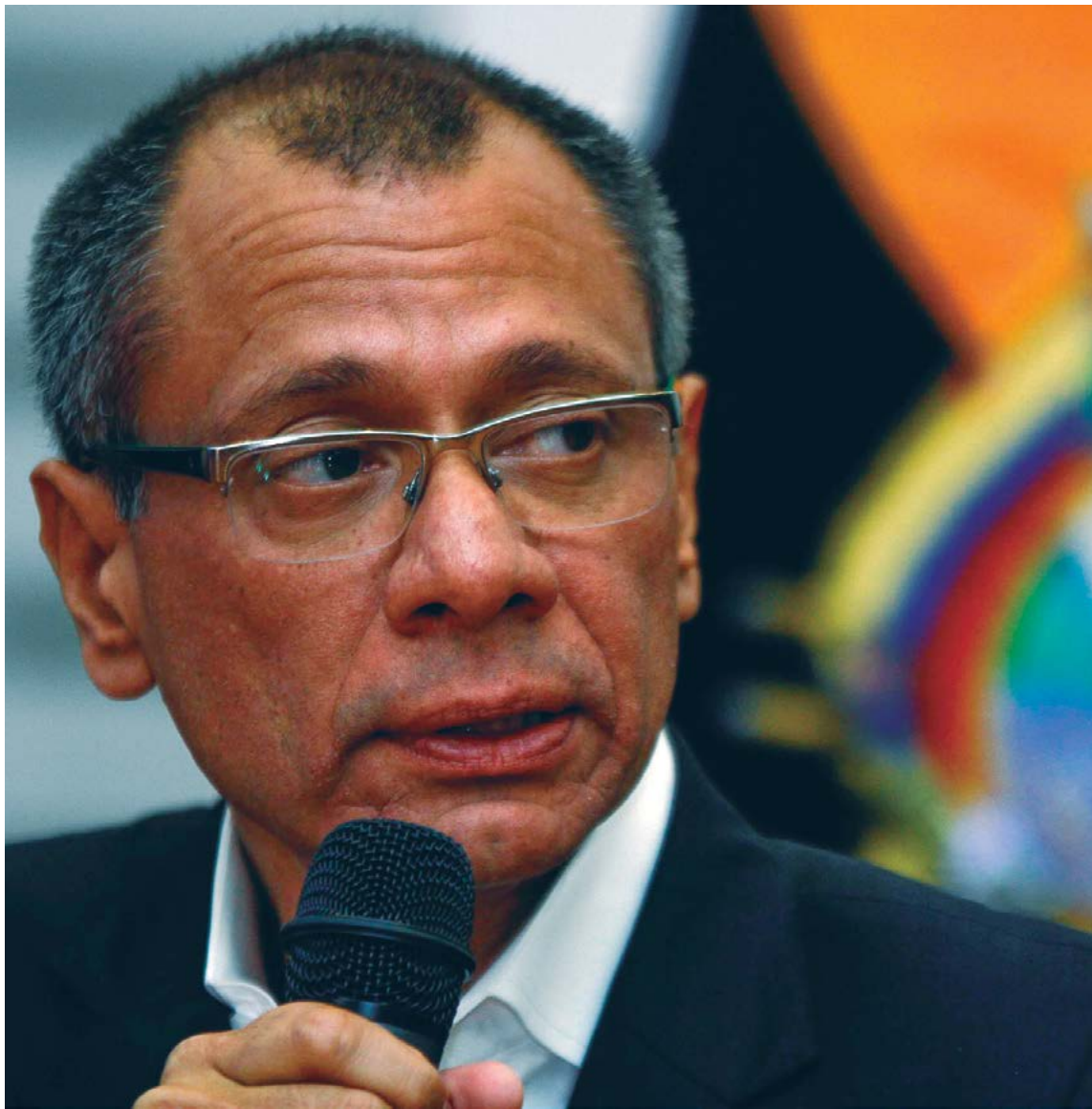
Department of Justice