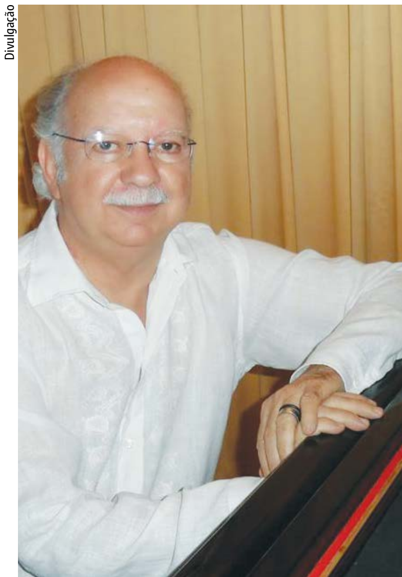
Metodologia Dalcroze é tema de cursos ministrados no Basileu França

10 VAGAS – Vendedor interno; ensino médio completo; experiência em vendas internas.