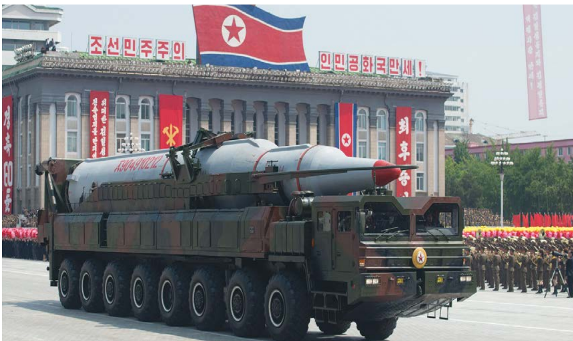
Governo Coreia do Norte

Os EUA adotaram as novas sanções depois que a Coreia do Norte lançou em 28 de julho seu segundo míssil intercontinental, como parte de testes para aprimorar sua tecnologia balística e conseguir alcançar