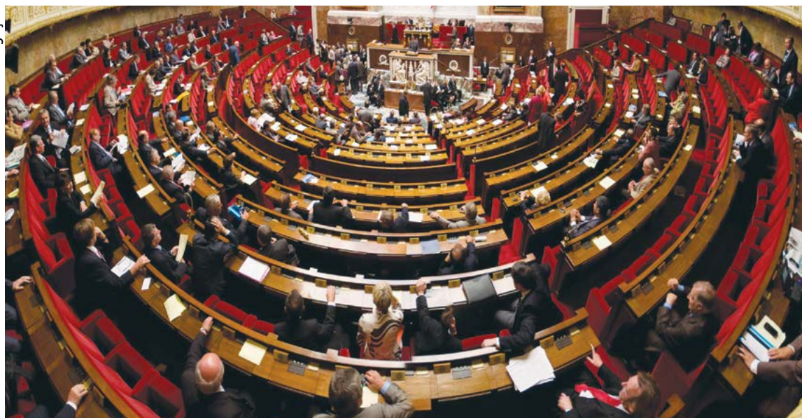
Sede do Parlamento Francês em Paris

O Parlamento da França proibiu na última quinta-feira (3), definitivamente, que os deputados contratem familiares como assistentes, uma medida que faz parte da lei de “moralização da vida pública”. A medida votada na Assembleia Nacional também afeta ministros, senadores e cargos públicos locais, e impede a contratação dos familiares mais próximos (cônjuge, pais e filhos).