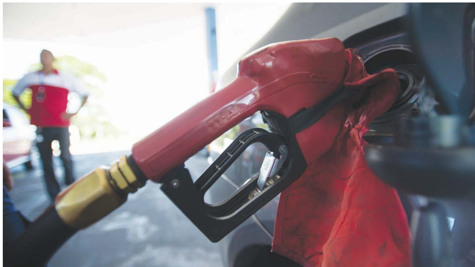
Marcelo Camargo / Agência Brasil

O partido de oposição argumenta que, conforme determina a Constituição, o aumento de tributos só poderia ocorrer por meio de projeto de lei votado