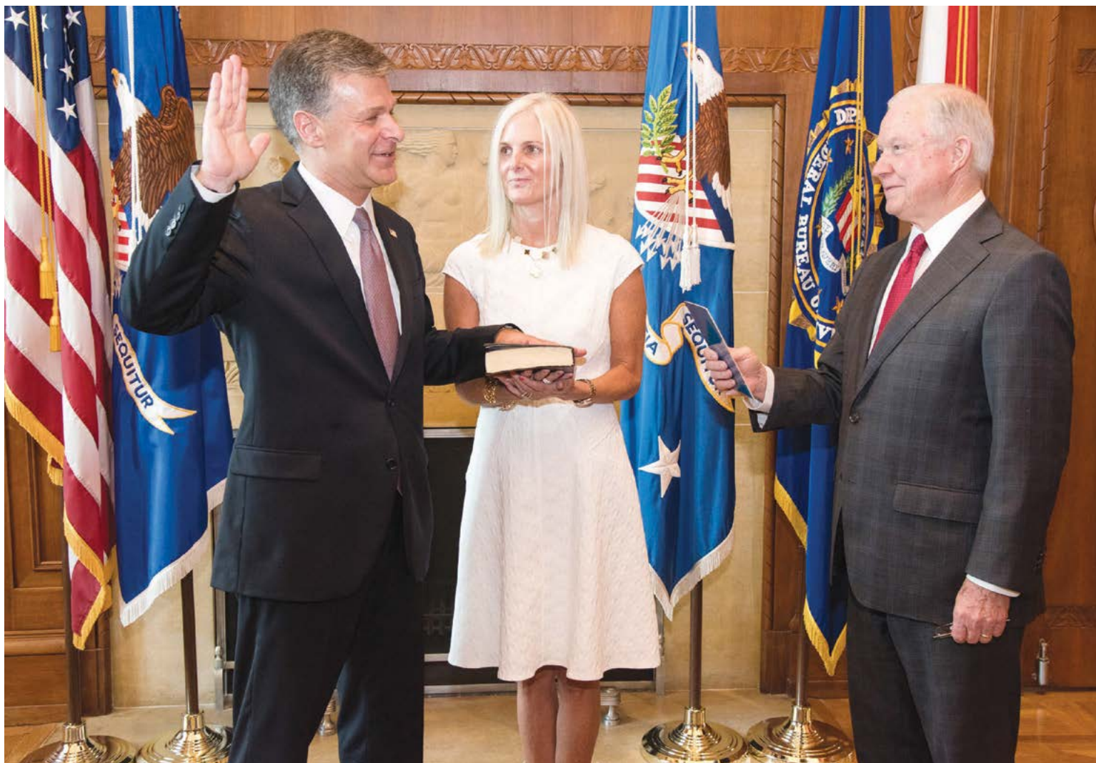
Department of Justice

Wray terá como desafio continuar as investigações sobre a suposta interferência da Rússia nas eleições presidenciais do ano passado, que, segundo dados do FBI, teriam prejudicado a ex-candidata Hillary Clinton e favorecido Trump.