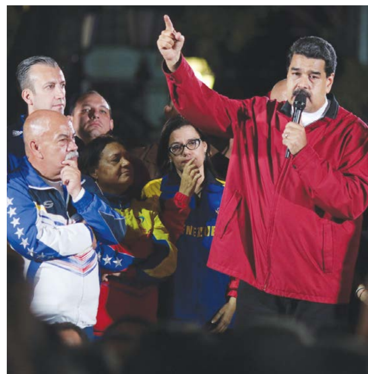
Governo da Venezuela

O Escritório do Alto Comissariado “lamentou” a morte destas pessoas e pediu às autoridades que as investiguem de forma independente.