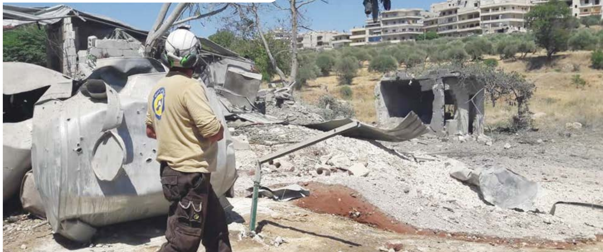
Civil Defense Idlib

Também foram destruídos um armazém de armas e oito veículos, entre eles, um carro-bomba