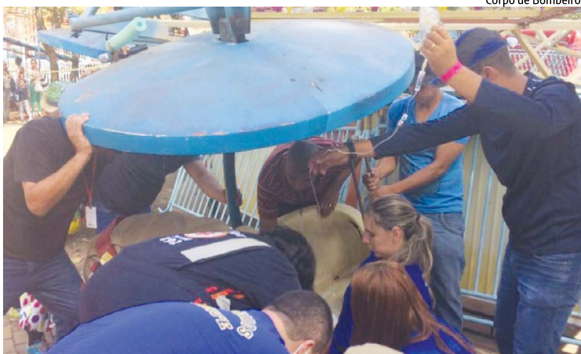
Corpo de Bombeiros

A Agência Municipal de Turismo, Eventos e Lazer (Agetul) informou que lamenta o acidente e que as vítimas foram atendidas rapidamente e encaminhadas imediata-