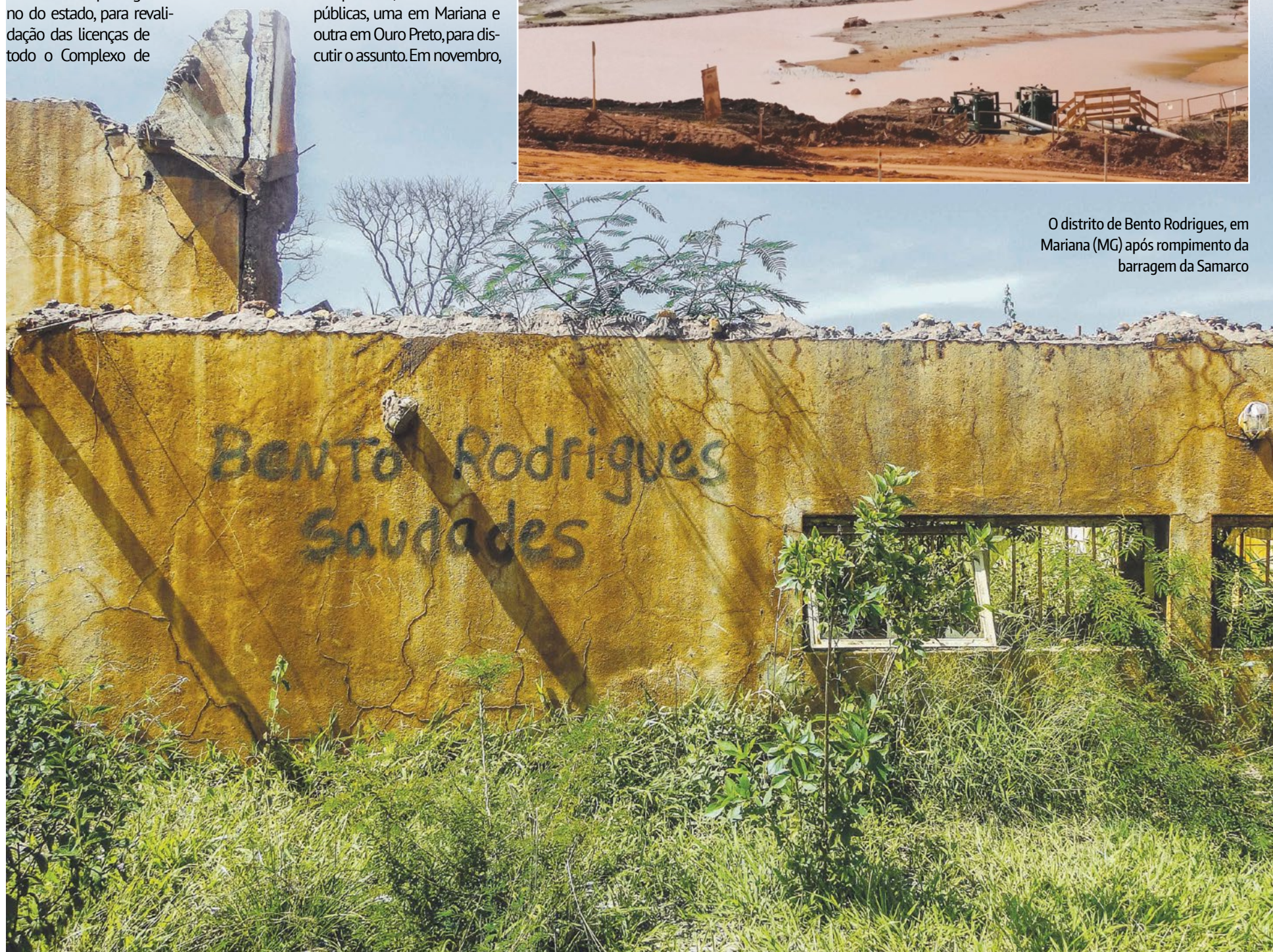
O distrito de Bento Rodrigues, em Mariana (MG) após rompimento da barragem da Samarco