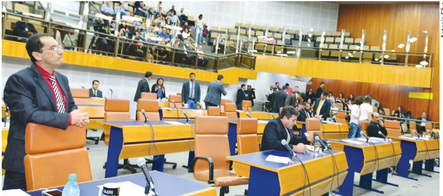
Sessão da Câmara em que foi aprovado o Programa de Recuperação Fiscal da Prefeitura de Goiânia