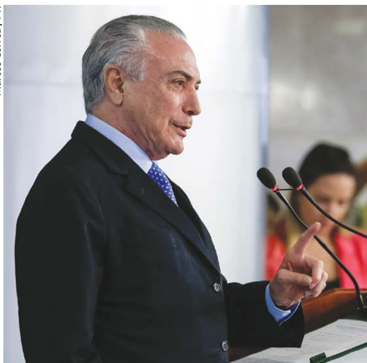
Marcos Corrêa / PR

portou neste pequeno aumento do PIS/Cofins. Exatamente para manter, em primeiro lugar, a meta fiscal que nós estabelecemos. Em segundo lugar, para assegurar o crescimento econômico que pouco a pouco vem vindo. Vocês estão percebendo que, aos poucos, o crescimento vem se revelando. Então, era preciso estabelecer este aumento do tributo para manter esses pressupostos que eu acabei de indicar”, disse o presidente.