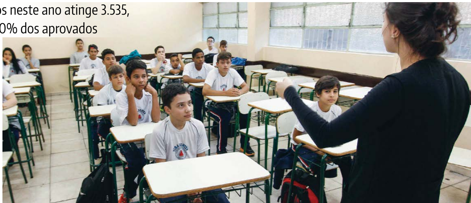
Pedro Ribas / ANPr copiar

A convocação contempla profissionais da Educação nas áreas de Artes Visuais, Música, Teatro, Dança, Geografia, História, Matemática, Ciências, Portu-