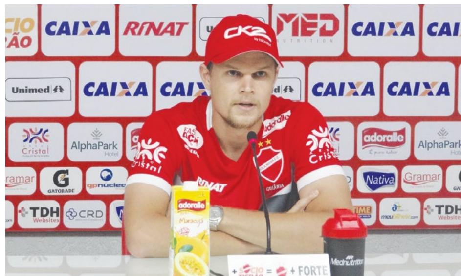
Vila Nova FC

No próximo sábado (22), o desafio será entre dois colorados. O Vila recebe o Internacional no Estádio Serra Dourada. Porém, não haverá a presença de torcedores, já que a equipe cumpre punição do STJD, onde deve realizar quatro jogos de portões fechados.