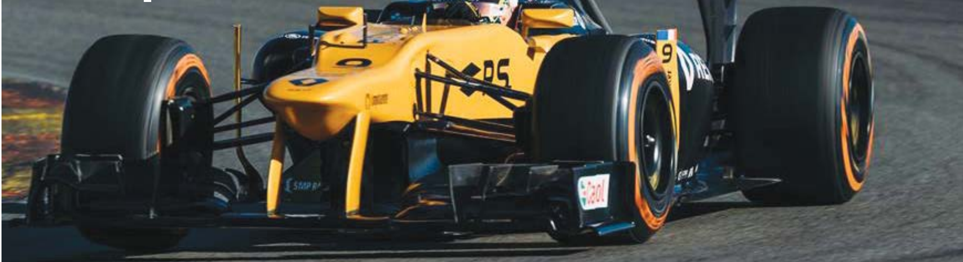
Renaul Sport F1 Team

Após acidente em 2011, o piloto já realizou testes pela escuderia neste ano