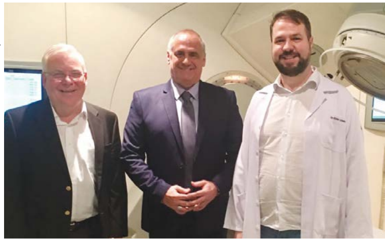
Prefeitura de Aparecida

Aproximadamente 85% dos tratamentos de câncer em Goiás, atualmente, são realizados pelo Hospital Araújo Jorge, os outros 15% são atendidos pela Santa Casa. Além disso, o câncer é a doença que mais mata adolescentes