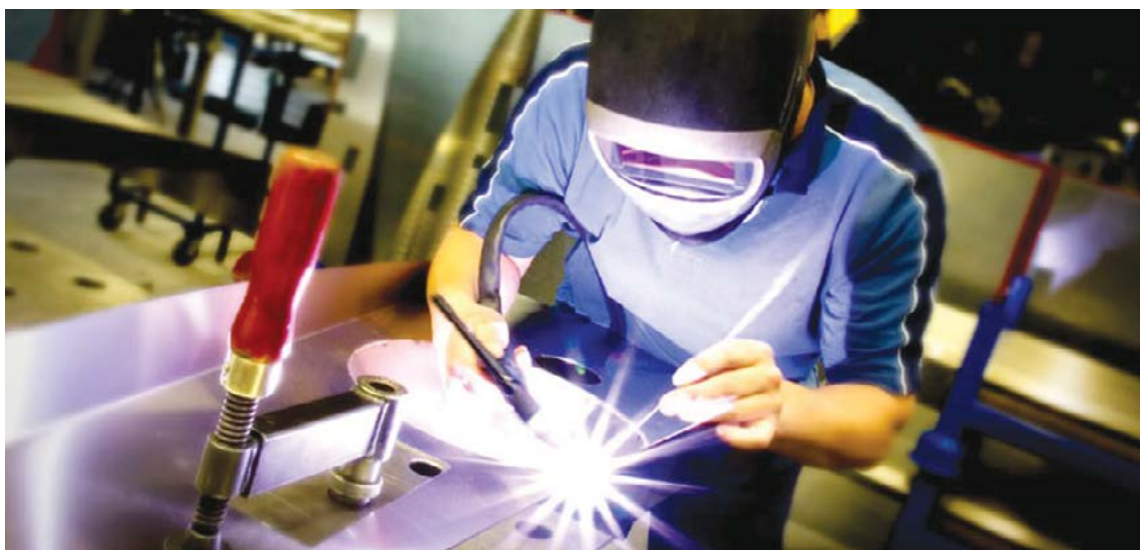
Governo de Goiás

As importações tiveram um incremento de 24% no período (1º semestre de 2017). O total das importações de junho somou US$ 287,3 milhões em Goiás, resultando na aquisição de 1.310 produtos de 62 países. Produtos farmacêuticos lideraram as importações no Estado, com US$ 83,4 milhões, totalizando 29% dos produtos adquiridos (19,72% a mais que em 2016). Adubos e fertilizantes aparecem em segundo lugar no ranking de produtos importados (22,95%), totalizando US$ 65,9 milhões. Em terceiro lugar, destacaram-se os veículos e suas partes, 11,18% das importações.