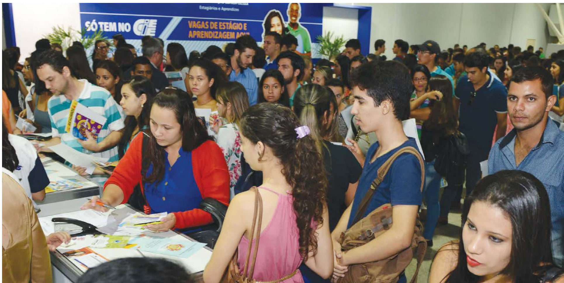
Governo de Goiás

Cerca de 14 mil bolsistas têm até o dia 20 deste mês para realizar a renovação do benefício