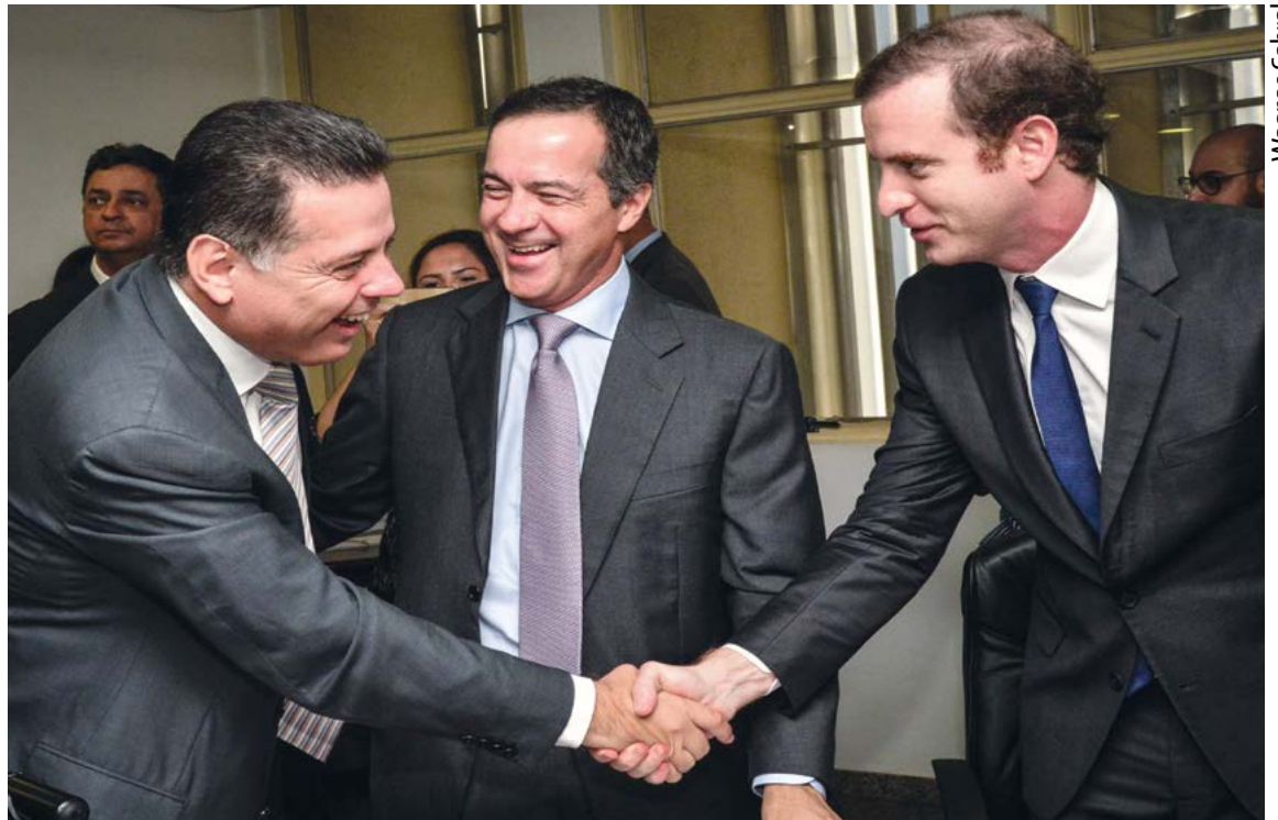
Reunião em que o Governo de Goiás assinou o protocolo de intenções com diretores da Kraft Heinz Brasil

Somados, os três novos empreendimentos representam um montante de R$ 583 milhões, considerado significativo na economia goiana. Em 2016, o território goiano recebeu 9 novas indústrias de ramos diversificados, totalizando R$ 896 milhões inje-