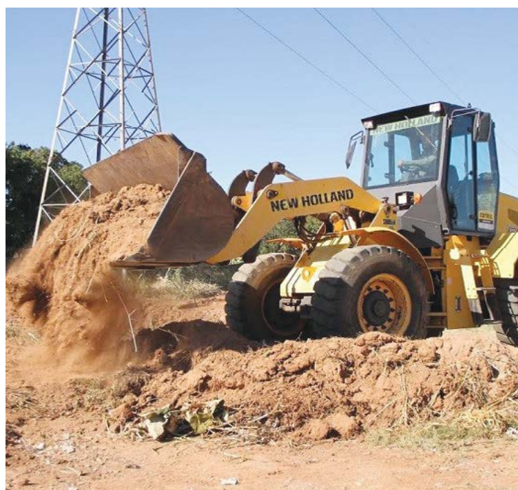
Prefeitura de Goiânia

da que a gestão de prefeito Iris Rezende se preocupa com a conscientização da população. "Trabalhar mais próximo do povo é uma prioridade da Prefeitura. Não apenas com a limpeza das ruas, mas também com os trabalhos de conscientização da população, para que não deposite lixo em locais impróprios, comprometendo a segurança, o visual do bairro e, principalmente, a saúde dos moradores. Este trabalho de alerta também realizado durante os Mutirões", finaliza.