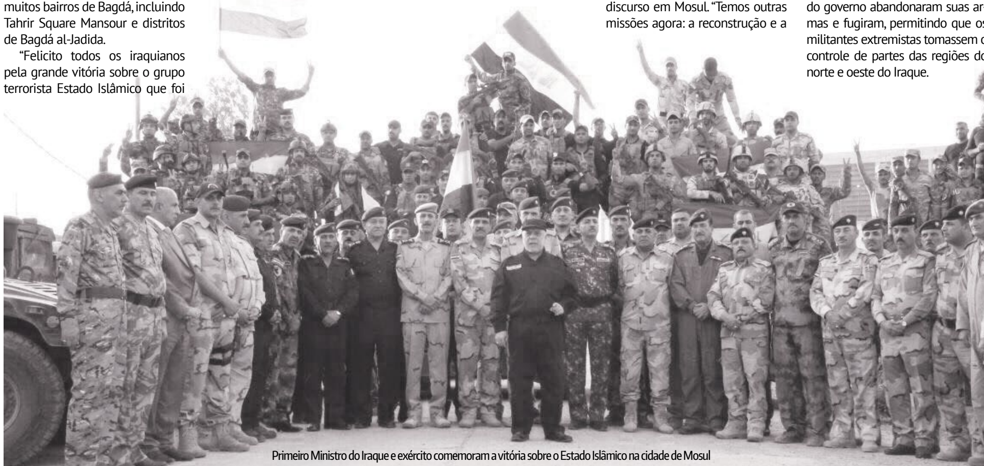
Primeiro Ministro do Iraque e exército comemoram a vitória sobre o Estado Islâmico na cidade de Mosul

Mosul fica 400 km ao norte da capital do Iraque e estava sob o controle do Estado Islâmico desde junho de 2014, quando as forças do governo abandonaram suas armas e fugiram, permitindo que os militantes extremistas tomassem o controle de partes das regiões do norte e oeste do Iraque.