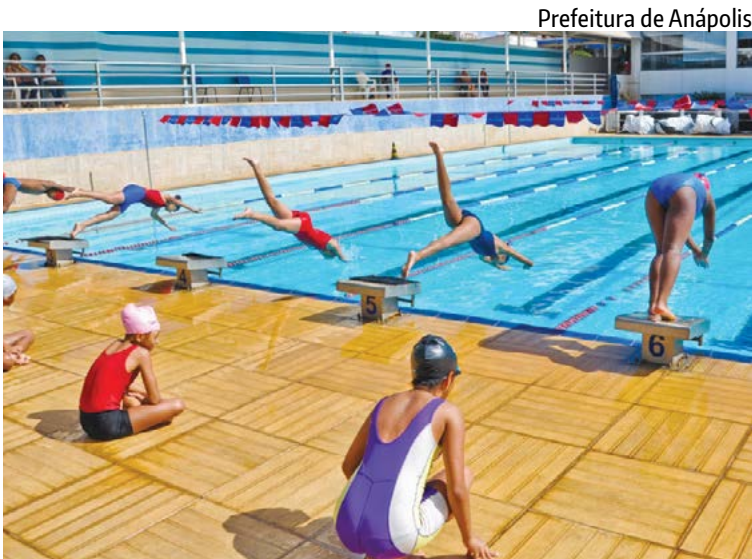
3º Festival de Inverno de Natação é um dos eventos que já movimenta a cidade

A programação oficial do aniversário de Anápolis já está acontecendo desde o dia 1º de julho, com a realização do 3º Festival de Inverno de Natação, primeira atividade de dezenas que vão ocorrer até o dia 31, quando a cidade completa 110 anos. São eventos para todos os gostos, idades e grupos sociais. Mas é, sobretudo, uma programação para a família e para o anapolino que, a cada ano, nesse período, se reencontra com a história do seu povo. São atrações culturais, esportivas, sociais e ações administrativas do governo municipal, dentre outras, que movimentam o município durante todo o mês. No cronograma, está a assinatura da ordem de serviço para a retomada das obras da Unidade de Saúde do Parque Iracema, que acontece no dia 13. Um verdadei-