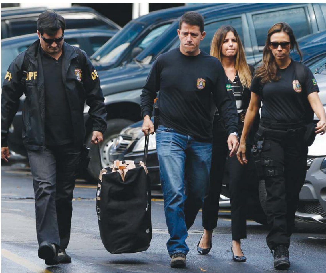
Polícia Federal cumpre mandados da Operação Ponto Final com objetivo de desarticular crimes no transporte do Rio