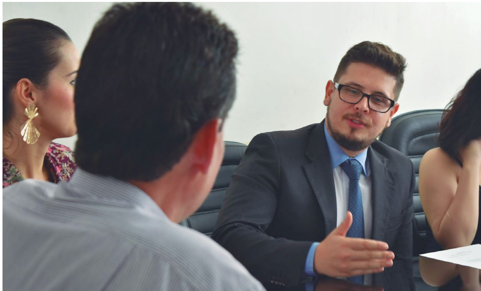
Prefeitura de Piracanjuba

Ao CNJ, o magistrado da comarca de Piracanjuba justifica que o recurso tecnológico se caracterizou como um aliado do