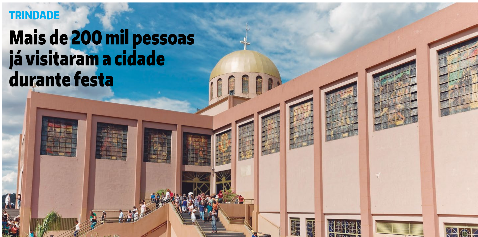
Prefeitura de Trindade

Tradicional Romaria do Divino Pai Eterno atrai devotos de todas as partes do país