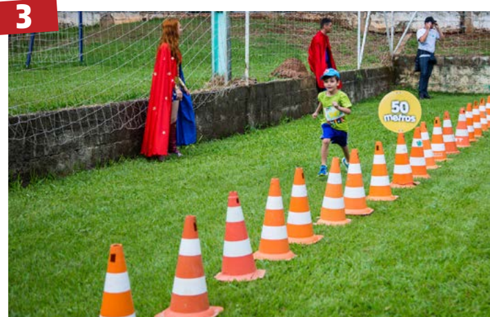
Corrida - Opus realiza corrida em combate à obesidade infantil, o evento acontecerá dia 30 de setembro na praça da rua T-23 tem como mote esse ano o combate à obesidade infantil.