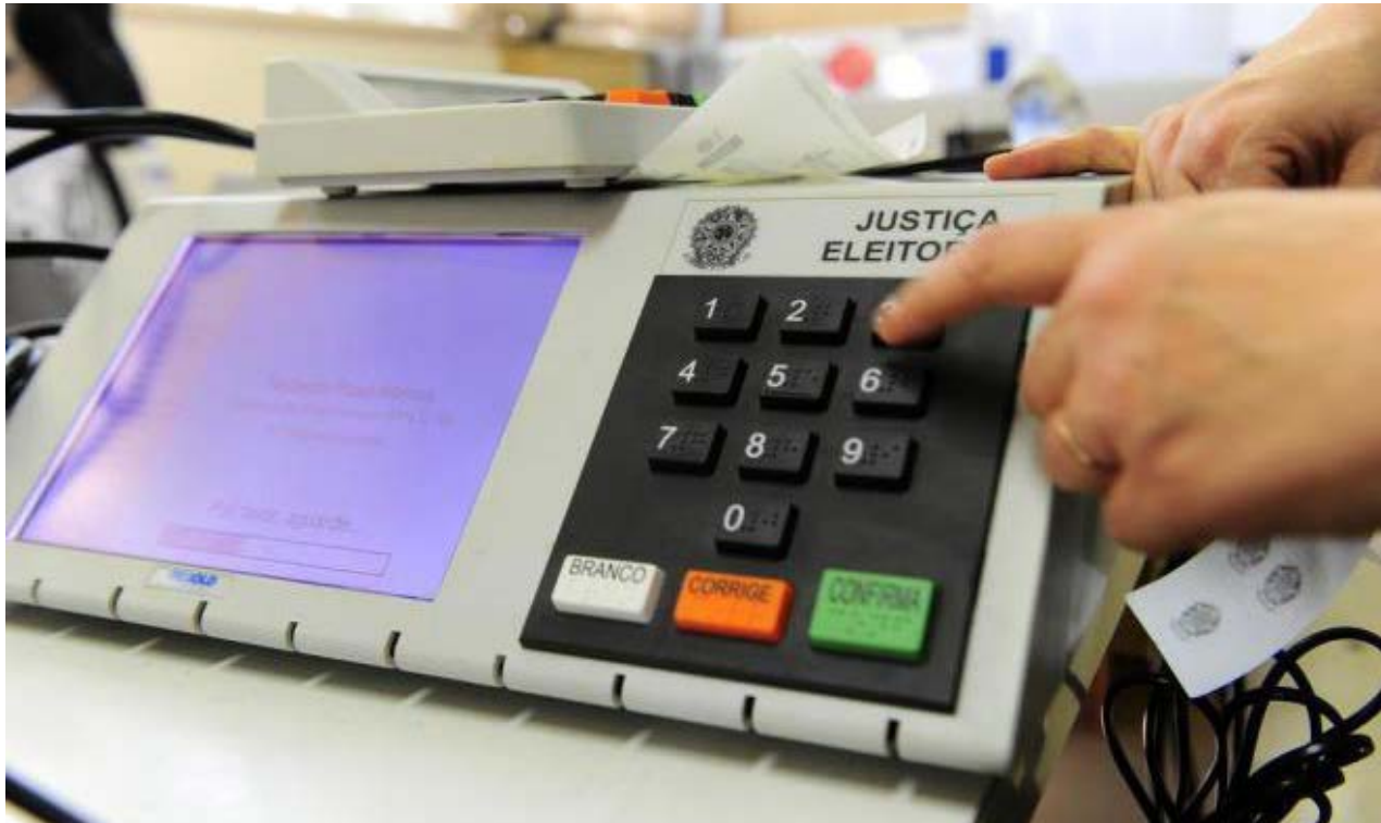
Nestas eleições, 406 brasileiros inscritos no exterior pediram para votar em trânsito no Brasil

Os eleitores que estiveram em trânsito no estado