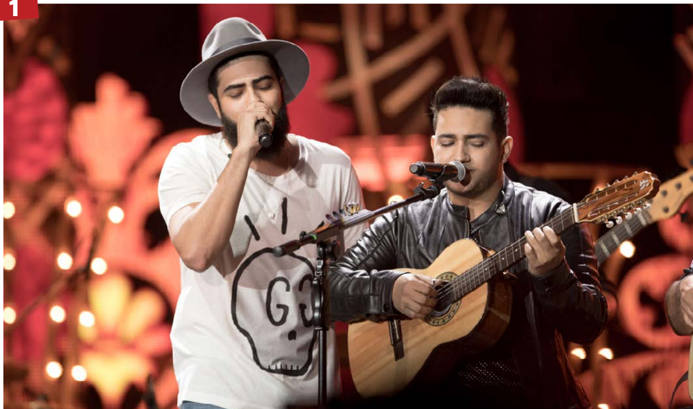
Dupla sertaneja - Henrique & Juliano, a dupla que arrasta multidões pelo país, se apresenta neste sábado (8), no complexo A Casa, a partir das 20h. Atualmente, os cantores seguem no topo das paradas de sucesso com a música "Aquele Povo".

Com forte atuação em Brasília, Goiás e Minas Gerais, a Brasal Incorporadora foi uma das sete empresas do setor imobiliário no Estado a receber o Selo de Responsabilidade Social e Ambiental Ademi 2018, concedido pela Associação de Empresas do Mercado Imobiliário de Goiás (Ademi-GO). A premiação reconhece empresas que tenham atendido, ao longo do último ano, o mínimo de 70% de 28 indicadores na área socioambiental.