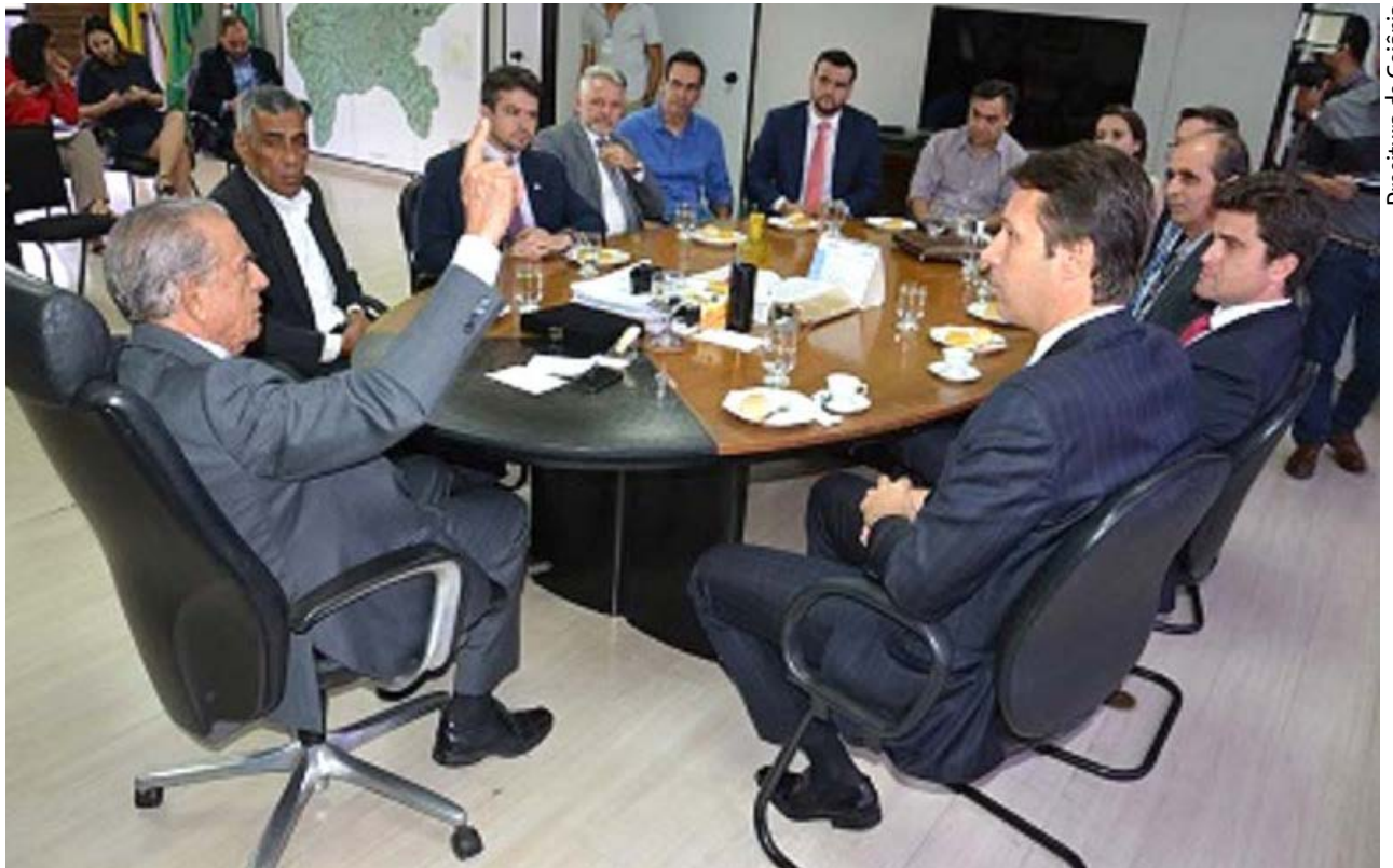
Prefeitura de Goiânia

A data também vai marcar o início dos trabalhos de construção do PMSB; sua elaboração é uma exigência da lei federal do saneamento básico, Lei nº 11.445/2007, que visa fornecer diretrizes ao poder público e à população para o planejamento e a execução de ações referentes ao saneamento do município para os próximos 20 anos. O prazo para conclusão do projeto é dezembro de 2018, seis meses após a assinatura da or-