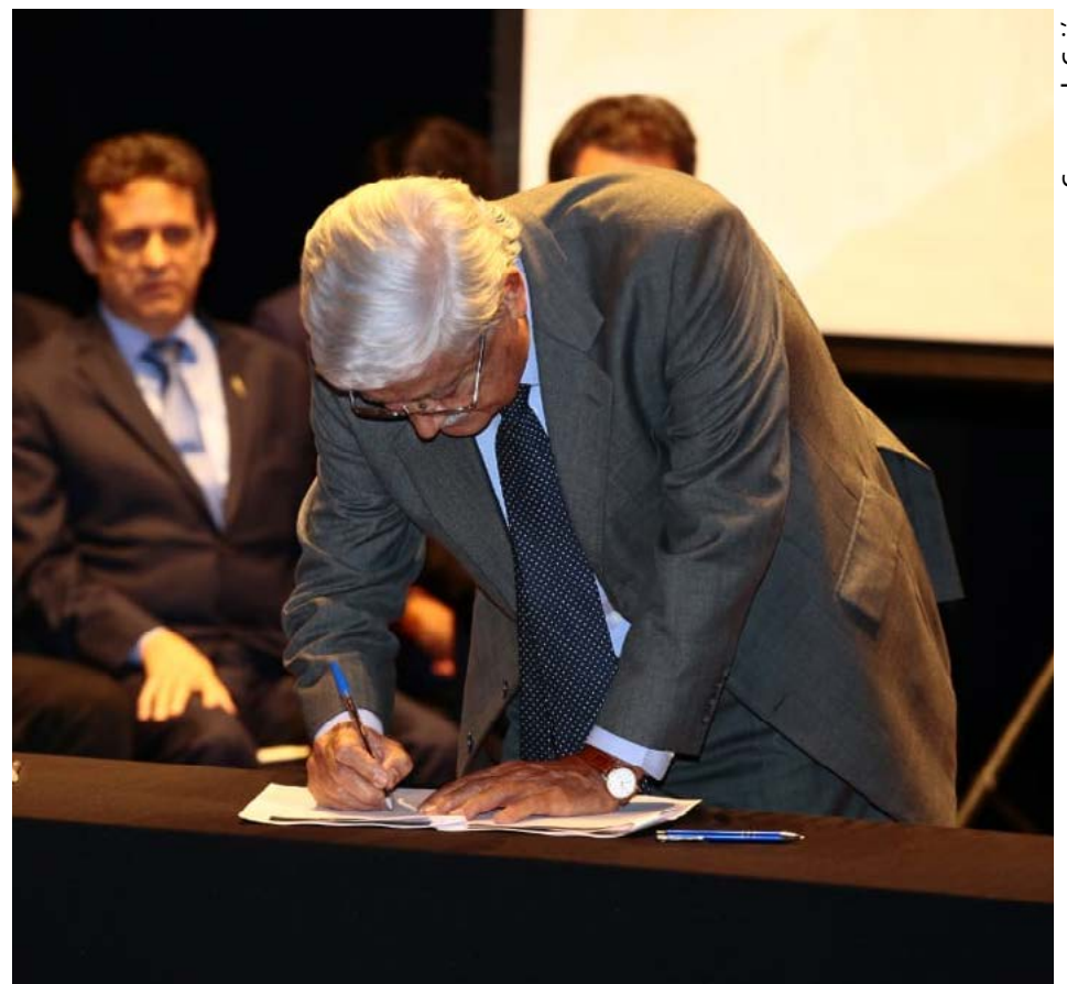
Governo de Goiás

- O município foi, por isso mesmo, escolhido como sede do Seminário Internacional Gestão de Sítios Culturais do Patrimônio Mundial no Brasil, que contou com a participação do Centro do Patrimônio Mundial e especialistas estrangeiros, de cidades reconhecidas pela Unesco, na Europa.