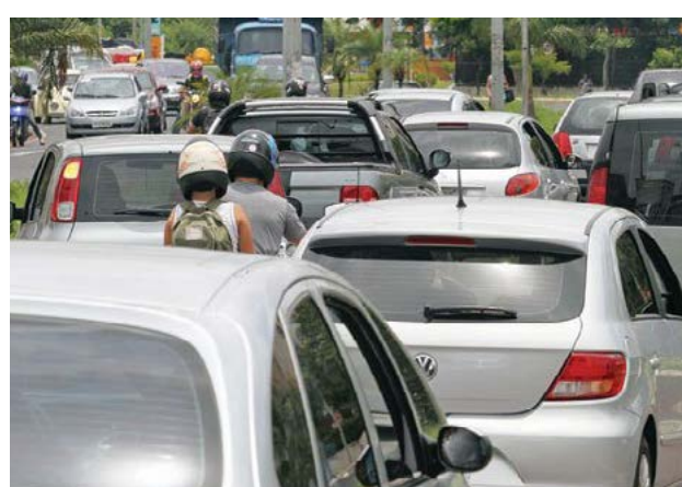
Assessoria de Imprensa do Procon Goiás

Ao contratar um seguro para um veículo, o consumidor deve: observar os preços, as formas de pagamento, valor de franquia, a cobertura e os serviços oferecidos. É preciso ainda conhecer seus direitos, principalmente numa necessidade de acionar a seguradora durante eventual situação de inadimplência e ainda a possível devolução de parte do valor pago em casos de cancelamento antes do término do prazo da cobertura. Por isso, é preciso estar atento à seguinte regra: cada parcela paga do seguro equivale a uma quantidade de dias de cobertura. Ou seja, a validade