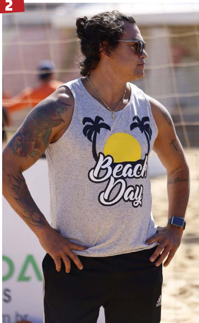
Presença - O ex-boxeador baiano Popó Freitas marcou presença em terras goianas para participar do Beach Day.