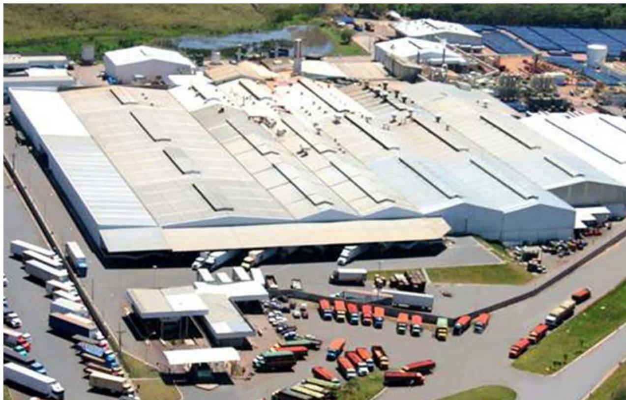
Comunicação Setorial - SED

Dois frigoríficos também tiveram projetos aprovados para investimentos, sendo um em Goiânia, que receberá uma unidade para abates exclusivamente de suínos, cujos investimentos fixos serão de R$ 6,1 milhões e oferecerão 15 empregos diretos. A outra planta será instalada em Aurilândia,