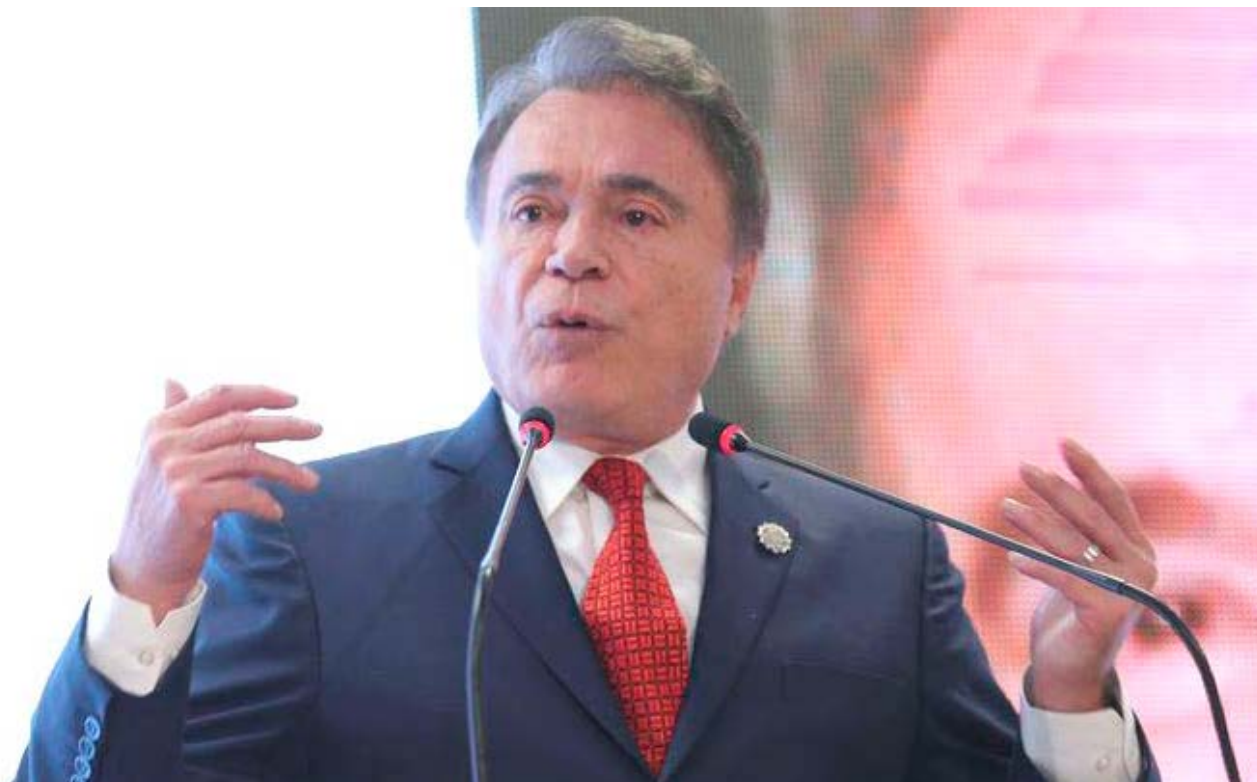
Álvaro Dias, candidato do Podemos, propõe a institucionalização da Operação Lava Jato

Álvaro Dias voltou a defender as reformas política, tributária e previdenciária. Essa última, como saída para cortar despesas e reduzir o déficit das contas públicas. Ainda para equilibrar a Previdência, Dias propõe instituir contas individuais capitalizadas. “Com os recursos da privatização, teremos um fundo para essa capitalização”, disse.