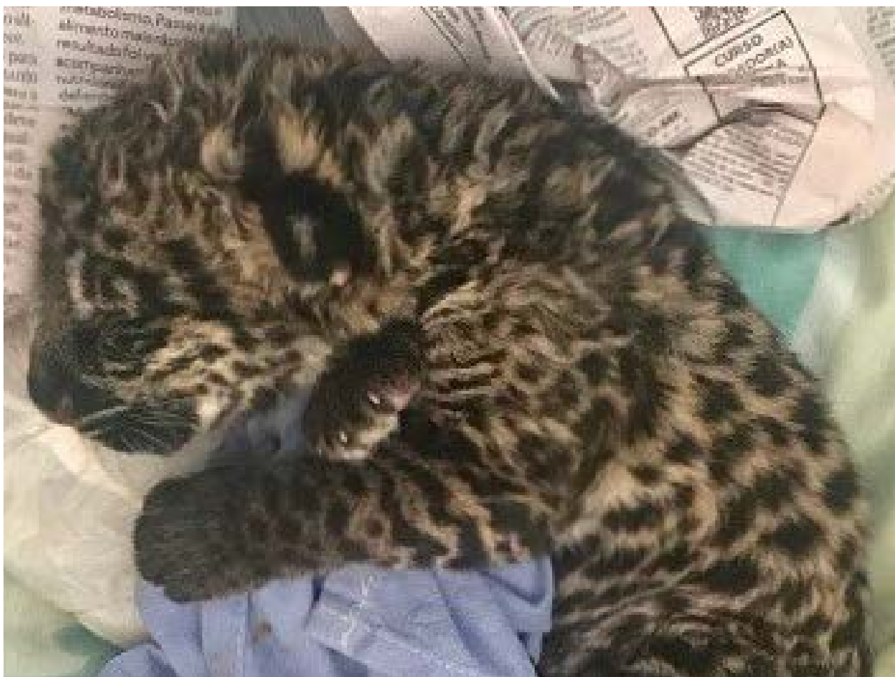
Prefeitura de Goiânia

idade e os machos de 4 anos. O período de gestação das onças-pintadas é de 93 a 105 dias e a ninhada pode ser de até 4 filhotes. Há dados que a população do animal no Brasil é inferior a 10 mil indivíduos, o que coloca a espécie ameaçada de extinção.