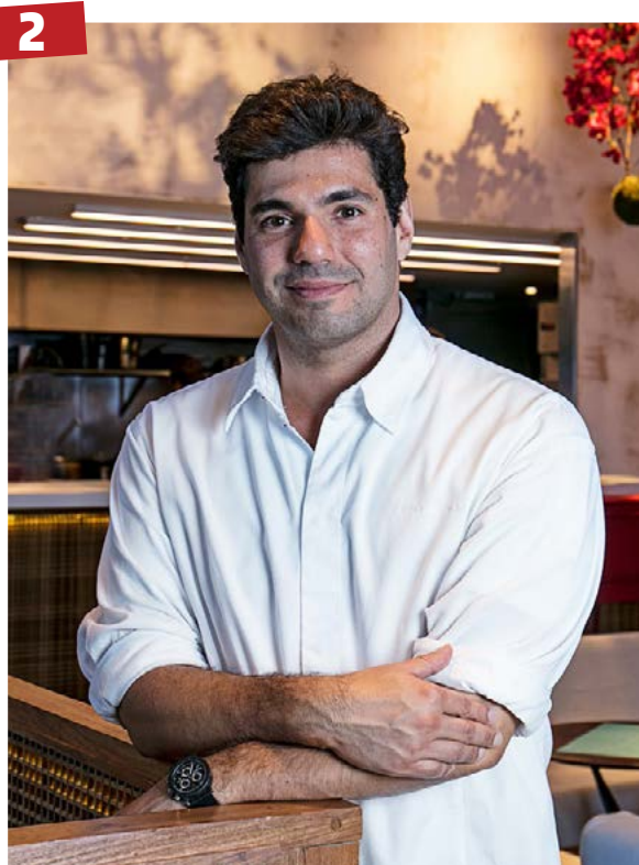
Hortifruti - Goiânia ganha unidade do Oba Hortifruti e haverá um cooking show com o renomado chef Felipe Bronze.