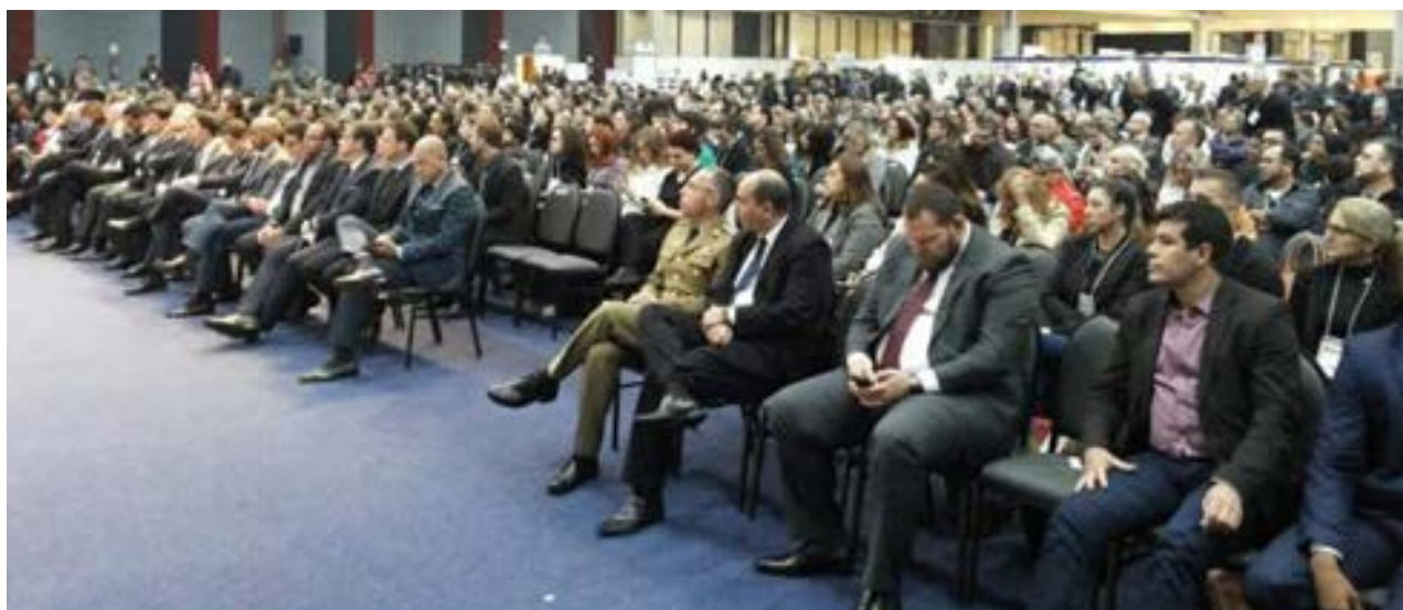
Diretoria-Geral de Administração Penitenciária

O encontro teve por objetivo proporcionar discussões sobre a política de trabalho prisional e de expor os trabalhos produzidos por pessoas em privação de liberdade em todo o País. O evento também teve o intuito de ampliar