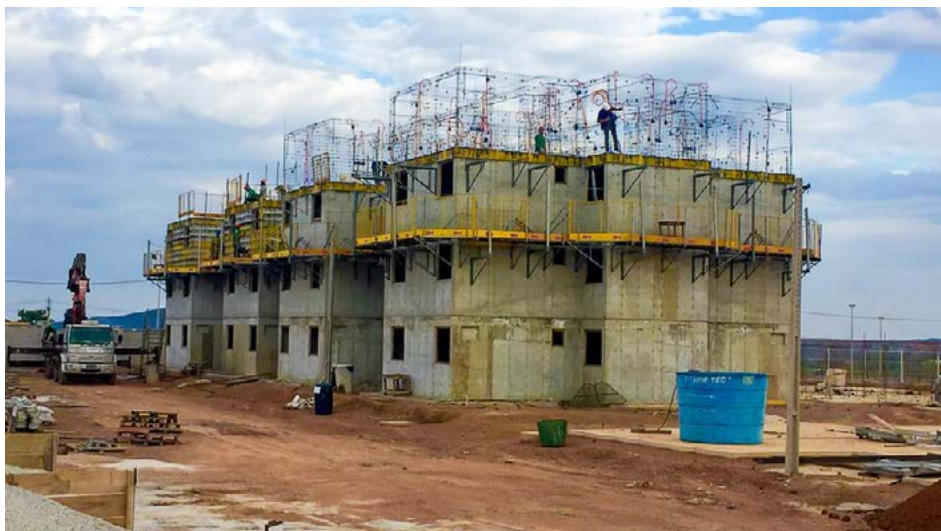
Assessoria de Imprensa Agência Goiana de Habitação

Participarão do sorteio somente as famílias que entregaram a documentação prevista em edital e foram aprovadas na