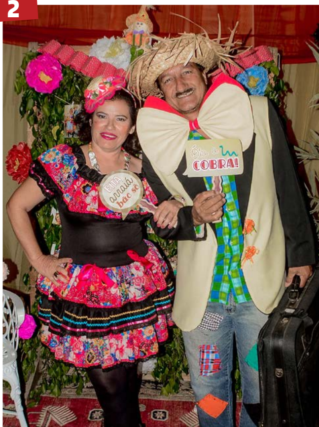
Julina - Dagmar Aparecida e Alexandre Borges devidamente trajados para curtir a festa julina.