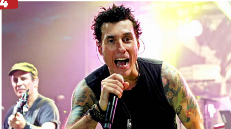
Deu Praia - Capital Inicial se apresenta nas areias do Deu Praia nesta sexta-feira (27). A banda retorna a Goiânia com show de lançamento de seu novo disco – Sonora.