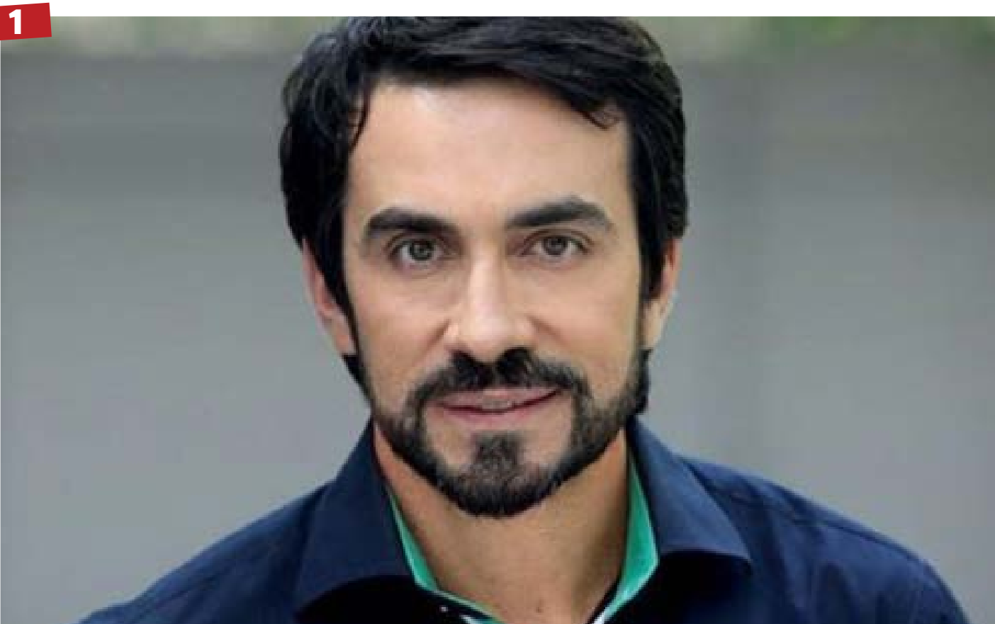
Arraiana – Neste domingo (29) em comemoração aos 111 da cidade de Anápolis, Padre Fábio de Melo, se apresenta no Arraiana, o evento é beneficente e o ingresso é apenas um quilo de alimento não perecível.