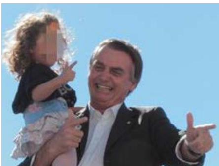
Foto tirada em Goiânia e repetida no Rio por Bolsonaro pegou muito mal. Usar crianças em campanha já parece ultrapassado. Agora, posar com criança fazendo pose de arma parece não ser correto em um momento em que a sociedade sofre com a falta de segurança. O portal Mais Goiás marcou ponto ao divulgar a foto, que correu mundo.