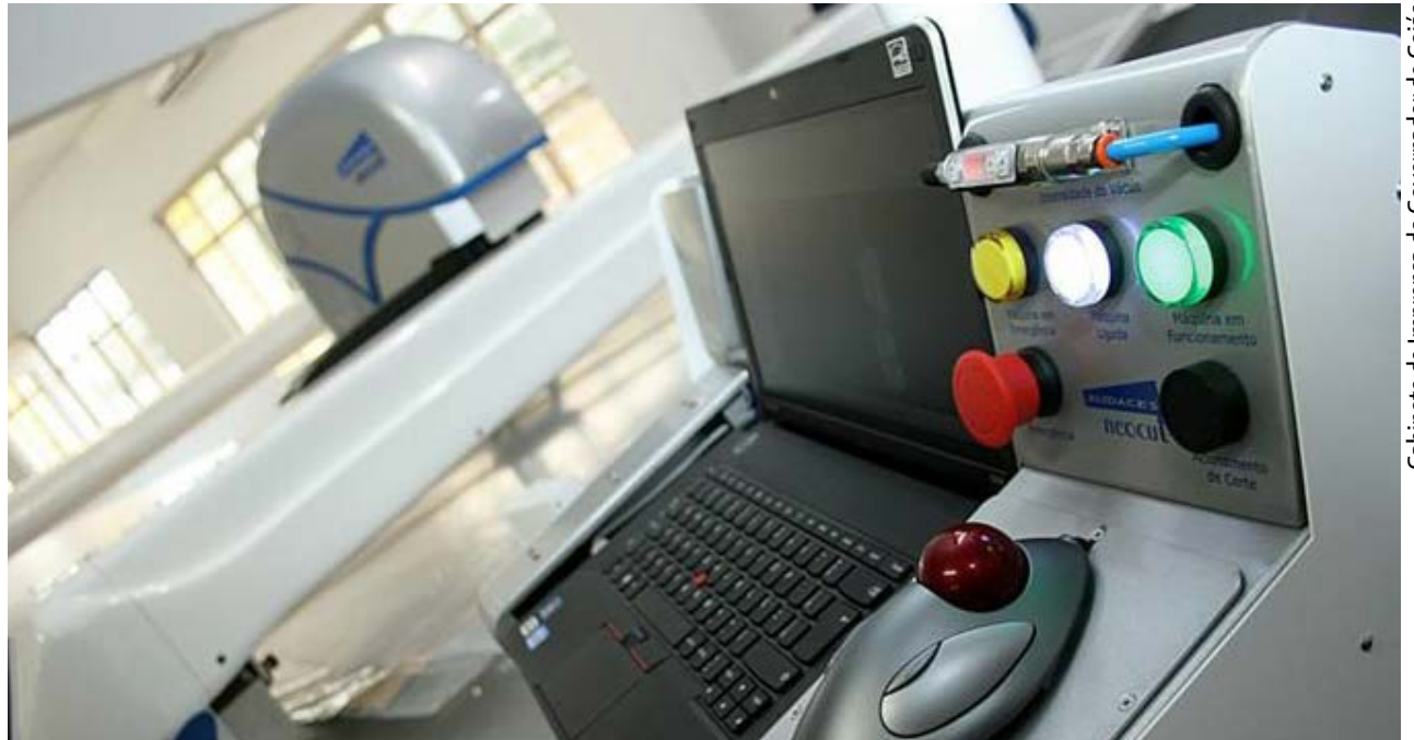
Gabinete de Imprensa do Governador de Goiás

Para garantir mão de obra qualificada para as empresas que estão chegando ou que já produzem no Estado, o Governo construiu os Institutos Tecnológicos de Goiás. Já são 24 unidades espalhadas por várias regiões que