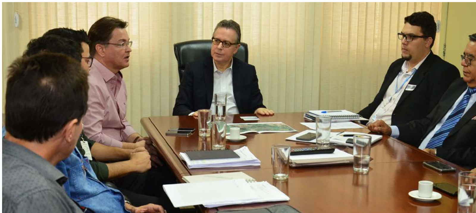
Governo de Goiás

A interligação entre os sistemas Meia Ponte e João Leite, responsáveis pelo abastecimento de água potável da capital, vai ser efetivada a partir da conclusão dessa adutora de grande porte na região Norte de Goiânia. A obra tem o valor global de 18 milhões e está a cargo da Saneago. A instalação possui tubu-