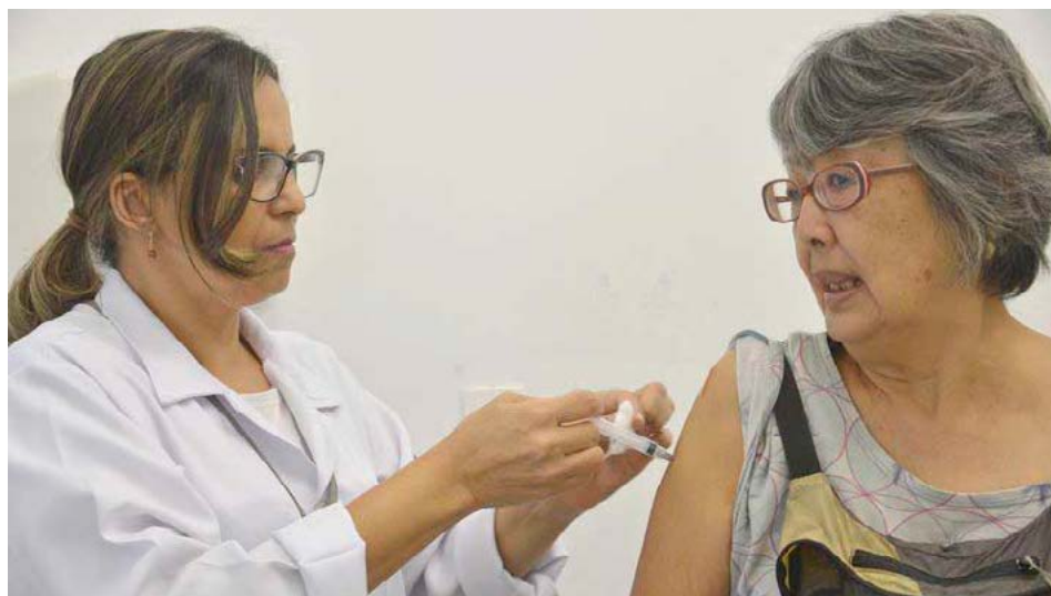
Sociedade Brasileira de Imunizações defende uma taxa de imunização de 95% do público-alvo

No ofício, a procuradora federal dos Direitos do Cidadão, Deborah Duprat, solicita que seja ampliado