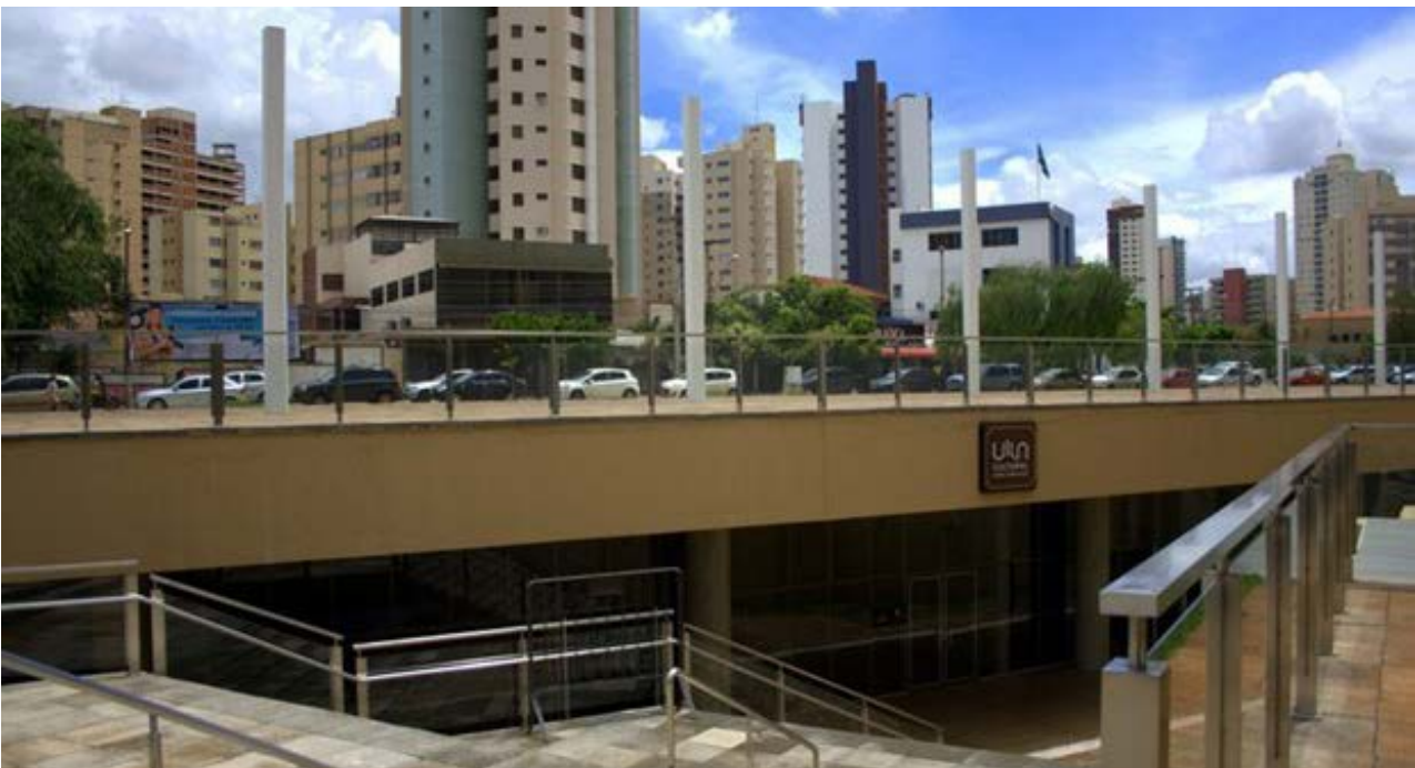
Vila Cultural Cora Coralina fica no Centro de Goiânia, no anexo do Teatro Goiânia