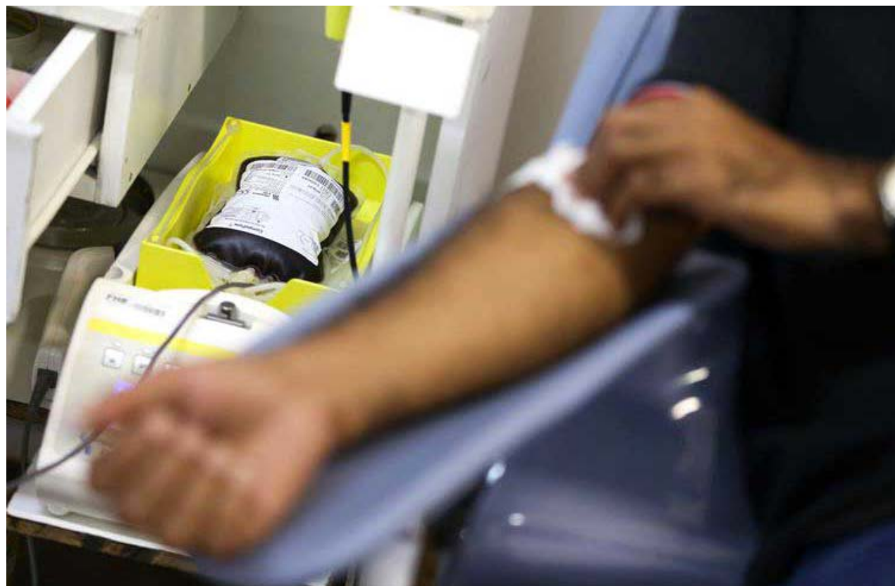
O Ministério da Saúde lança campanha para marcar o Dia Mundial do Doador de Sangue

“A ideia é ajudar quem precisa. Uma coisa tão simples, mas que pode salvar vidas e realizar o sonho de muita gente. É fazer o bem sem olhar a quem. É isso”, afirmou o técnico. “E, aproveitando o clima de Copa do Mundo, acho que marquei um golaço”, brincou,