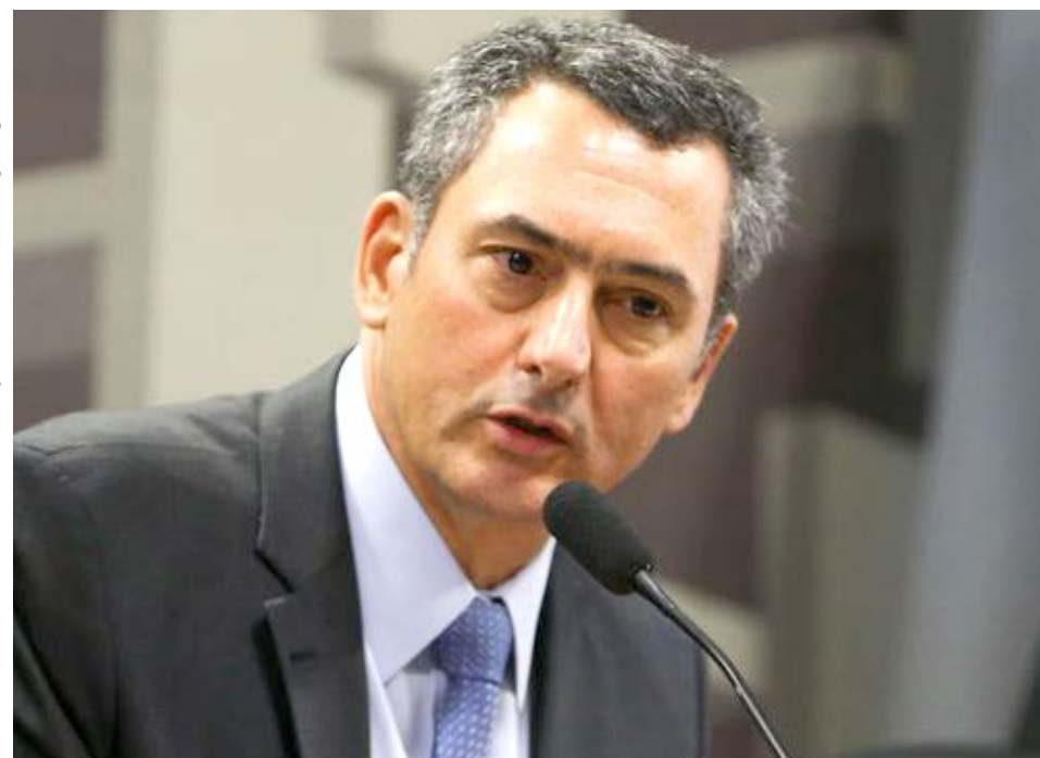
Ministro Eduardo Guardia culpou “o grave desequilíbrio fiscal” pela crise que atingiu o Brasil

O ministro da Fazenda, Eduardo Guardia, disse na terça-feira (5) que não existe solução consistente para a crise fiscal sem a reforma da Previdência. Ele participou do seminário Diálogo Público - Financiamento de Estados e Municípios: desafios para um novo pacto federativo, organizado pelo Tribunal de Contas da União (TCU).