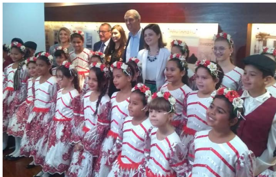
Governo de Goiás

Na gastronomia, também haverá novidades. Pela primeira vez o Festival contará com um estande dedicado exclusivamente para o café italiano, bebida que é considerada uma paixão entre os italianos. O evento abrigará uma edição especial da Carnivaria Open Air, um dos mais