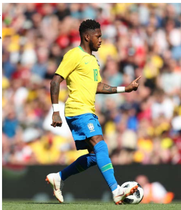
Aos 25 anos, Fred será o sétimo brasileiro a defender o Manchester United na história