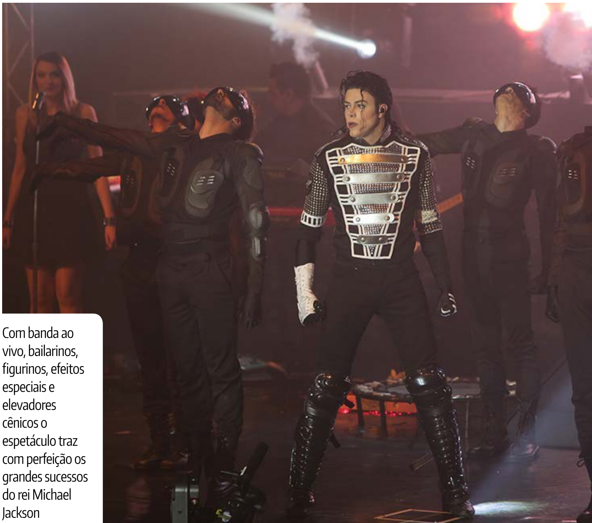
Assessoria de Imprensa

Com banda ao vivo, bailarinos, figurinos, efeitos especiais e elevadores cênicos o espetáculo traz com perfeição os grandes sucessos do rei Michael Jackson