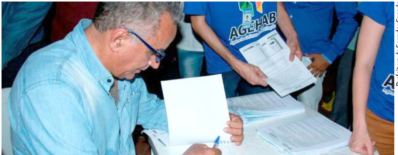
Prefeitura de Senador Canedo

Também foi cumprida etapa do convênio com a Liga de Mulheres do Jardim Liberdade e Região, beneficiando 79 famílias com Cheque Mais Moradia,