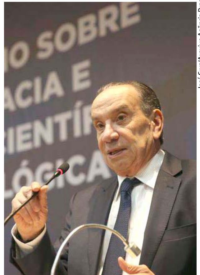
O ministro das Relações Exteriores, Aloysio Nunes, instruiu a embaixada brasileira em Washington, a solicitar a liberação completa dos registros

“O senhor, assim como nossa família, sabe o que foi o terror e a violência promovida pela Ditadura Brasileira. Uma nação precisa conhecer a sua história oficialmente para ter políticas públicas que previnam que os erros do passado se repitam”, diz a carta assinada pelo filho de Herzog e dirigida ao ministro Aloysio Nunes.