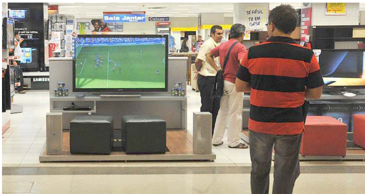
Comércio espera que a Copa resulte na venda de 12,5 milhões de aparelhos de tv em todo o país, total 10% superior ao de 2017

Com base na apuração feita com suas associadas, a Associação Brasileira de Agências de Viagens (ABAV) indica que até o momento as vendas estão dentro da normalidade para o período, e que, em geral, elas se intensificam