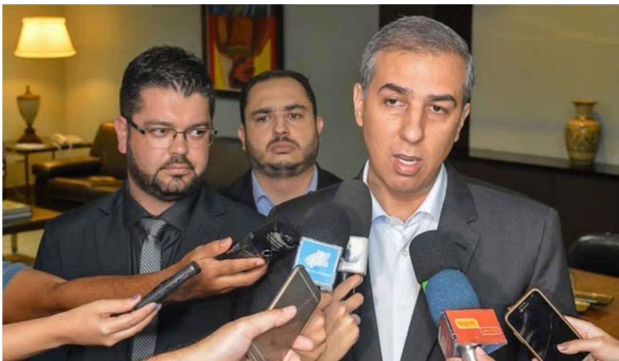
Comunicação Setorial – SED