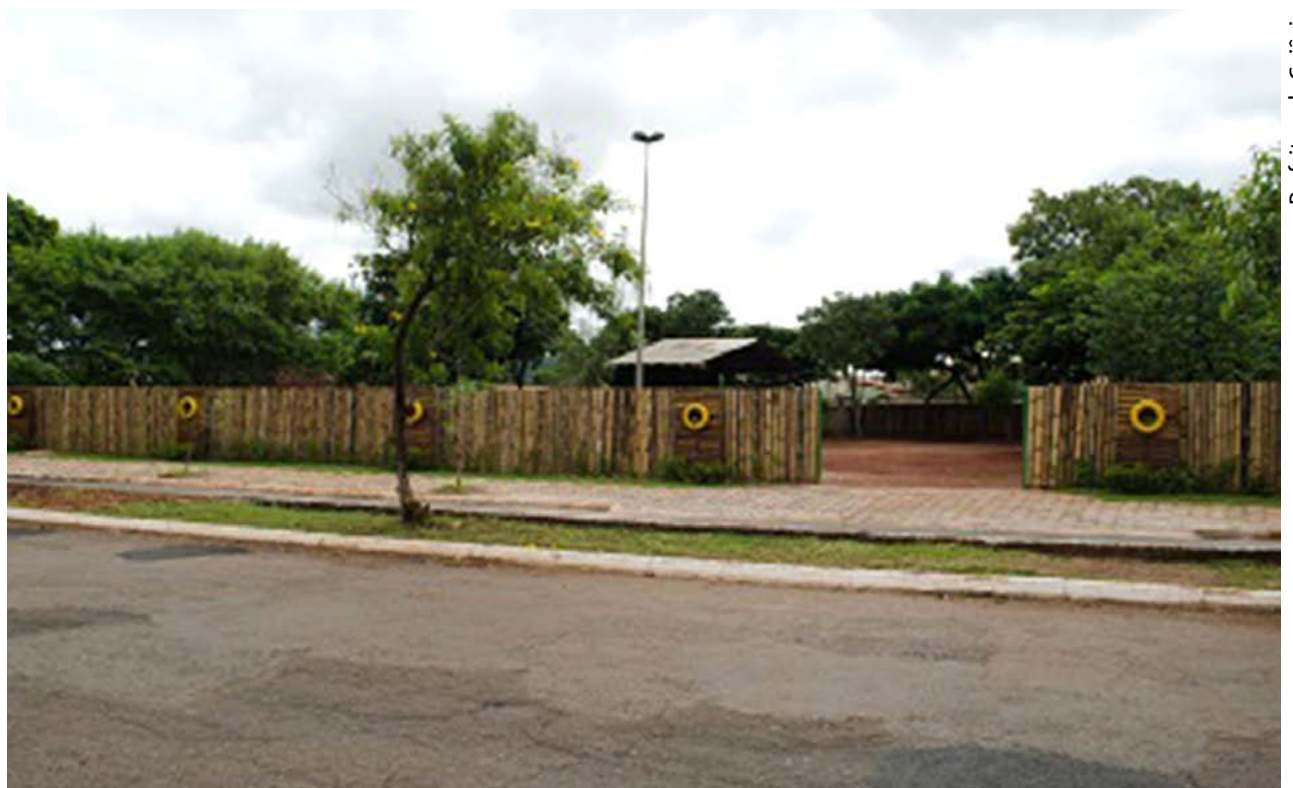
Prefeitura de Goiânia

Outro objetivo da administração municipal com esse espaço é reduzir os pontos de descarte irregular nas vias públicas e, consequentemente, diminuir a quantidade de vetores transmissores de doenças, principalmente do Aedes aegypti . Além disso, é prevista a redução de gastos com a remoção de resíduos porta-porta e os provenientes de descargas clandestinas. O Ecoponto funcionará todos os dias das 7h às 19h. Ele será operado por uma equipe da Comurg, que fará a triagem dos resíduos e encaminhará para destinação correta.