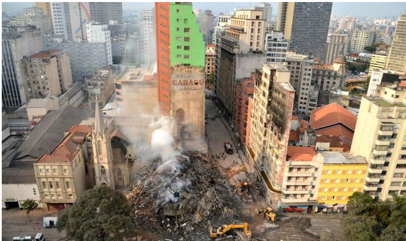
Bombeiros trabalham na busca de desaparecidos e retirada dos destroços do prédio que desabou após incêndio em São Paulo

A prefeitura utilizou o cadastro realizado em março passado pela Secretaria Municipal de Habitação com as fa-