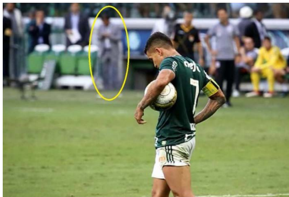
Palmeiras alega interferência externa por ver membros da comissão de arbitragem com celular

Ouçó dizer agora, nos corredores da Justiça Desportiva, que a Procuradoria do TJD/SP, buscará convencer os incautos, leigos e apaixonados pelo velho