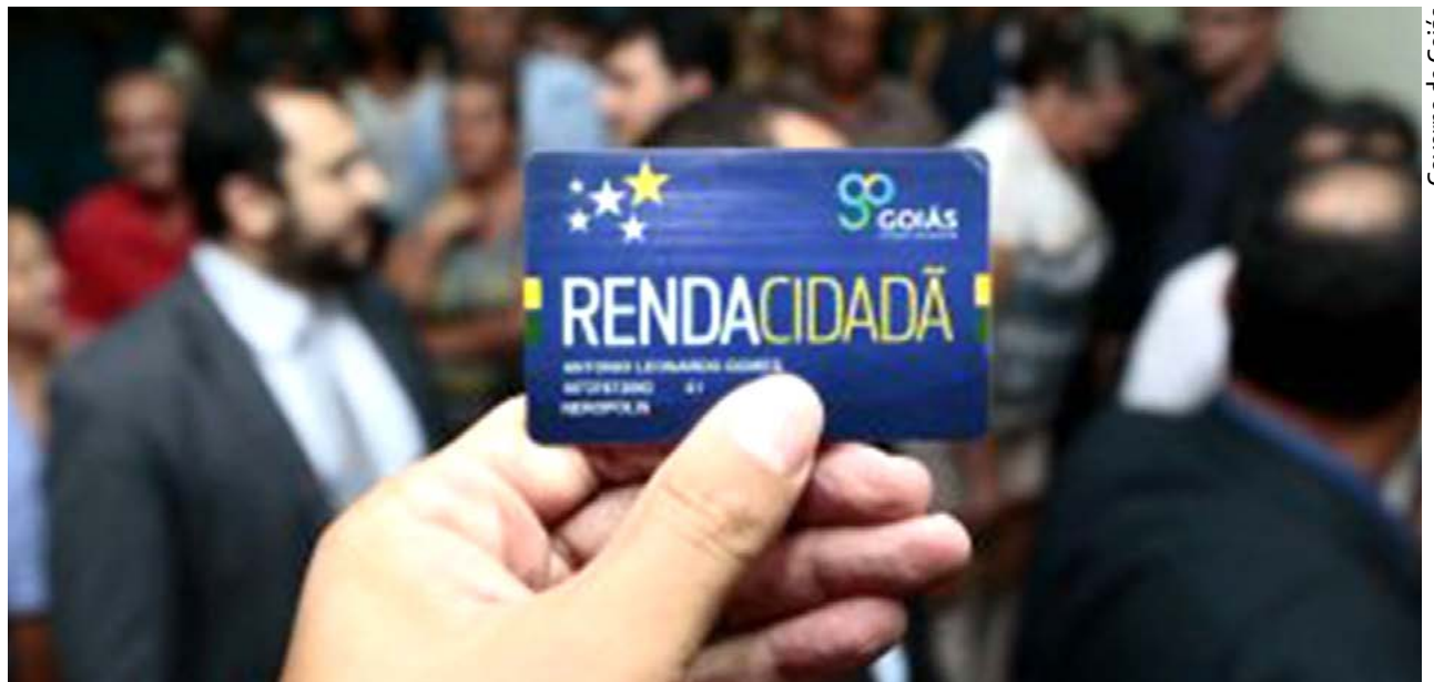
Governo de Goiás

O Renda Cidadã é um dos principais programas