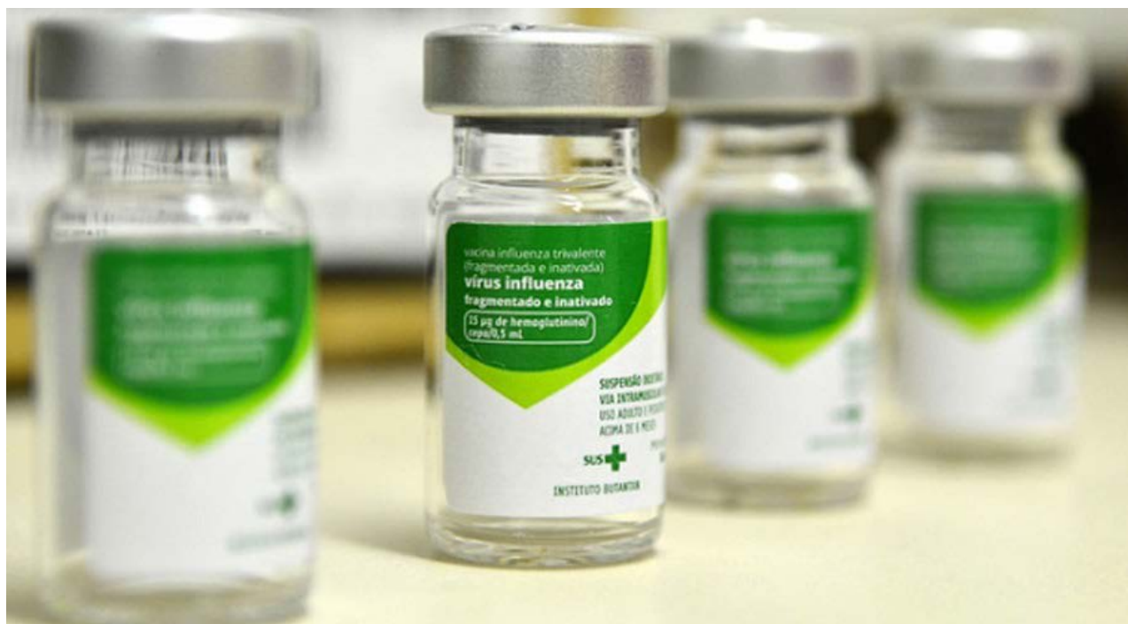
Prefeitura de Goiânia

Cerca de 320 mil pessoas já se vacinaram em Goiânia e os idosos fazem parte do grupo com a maior taxa de cobertura até o momento. A estimativa é que 95% da população com idade igual ou superior a 60 anos já tenha se vacinado. Entre os trabalhadores da área de