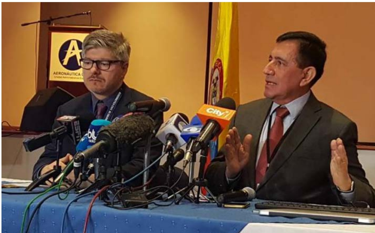
Representantes da Aeronáutica Colombiana durante a divulgação do relatório final

Com o relatório final, também é possível afirmar que o controle de tráfego aéreo desconhecia a “situação gravíssima” do avião naquele momento, e que a tripulação do avião da Chapecoense era experiente, com