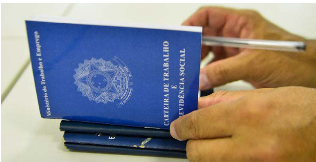
Total de empregados com carteira de trabalho assinada atingiu 32,9 milhões de pessoas. Já os empregados sem carteira assinada somam 10,7 milhões

gados sem carteira assinada ficou em 10,7 milhões de pessoas, uma redução de 402 mil pessoas em relação ao último trimestre de 2017, mas uma alta de 5,2% de 533 mil pessoas em relação ao primeiro trimestre do ano passado.