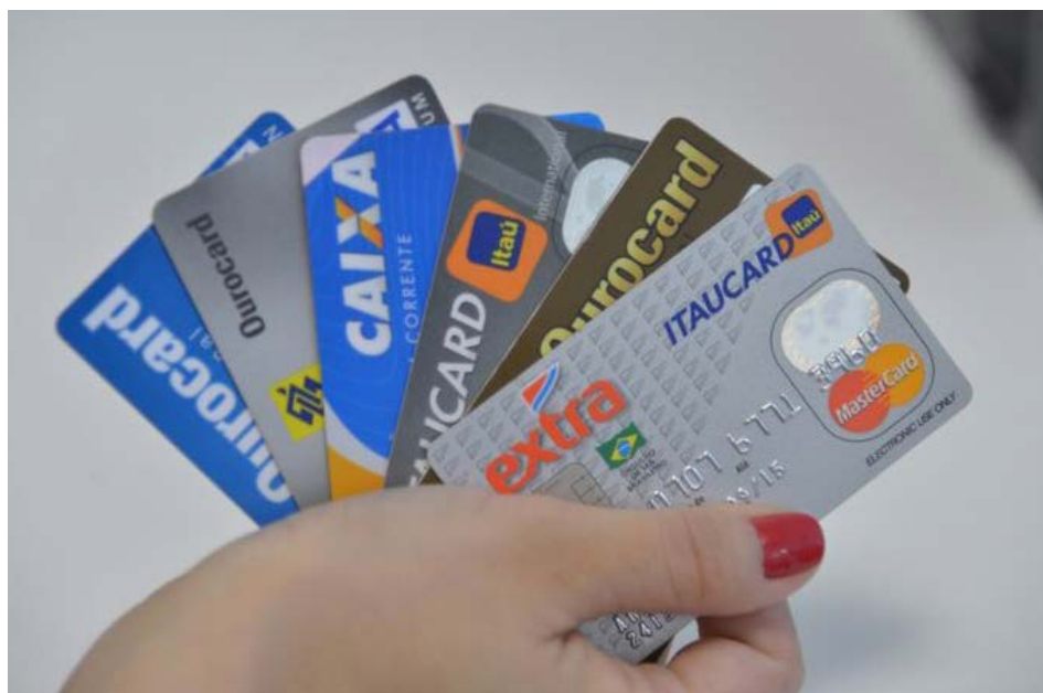
A partir de agora, os juros para clientes que não pagam rotativo do cartão estão padronizados

Por decisão do STJ, os bancos podem cobrar 2% de multa (sobre a dívida total) e 1% ao mês de ju-