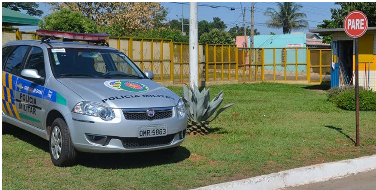
Governo de Goiás

Dentro do policiamento nos terminais, a Polícia Civil instituirá uma unidade especializada da Delegacia Estadual de Investigações Criminais (Deic) para investigar crimes cometidos contra usuários do transporte coletivo, além de mapear agressores ou grupos crimi-