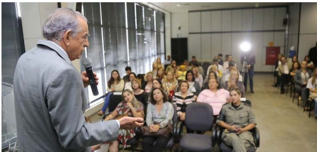
Prefeitura de Goiânia

Em seguida, o prefeito lembrou ainda que por acreditar na luta das mulheres que criou a Delegacia da Mulher e o Batalhão Feminino da Polícia Militar do Estado de Goiás. “Sempre acreditei na importância do espaço feminino na política e na gestão pública. Caminhamos muito, mas quero hoje dizer que vocês podem contar comigo para continuar nesta caminhada. A luta do respeito à mulher em todas as esferas é nossa. Não desistam! Não se acomodem!