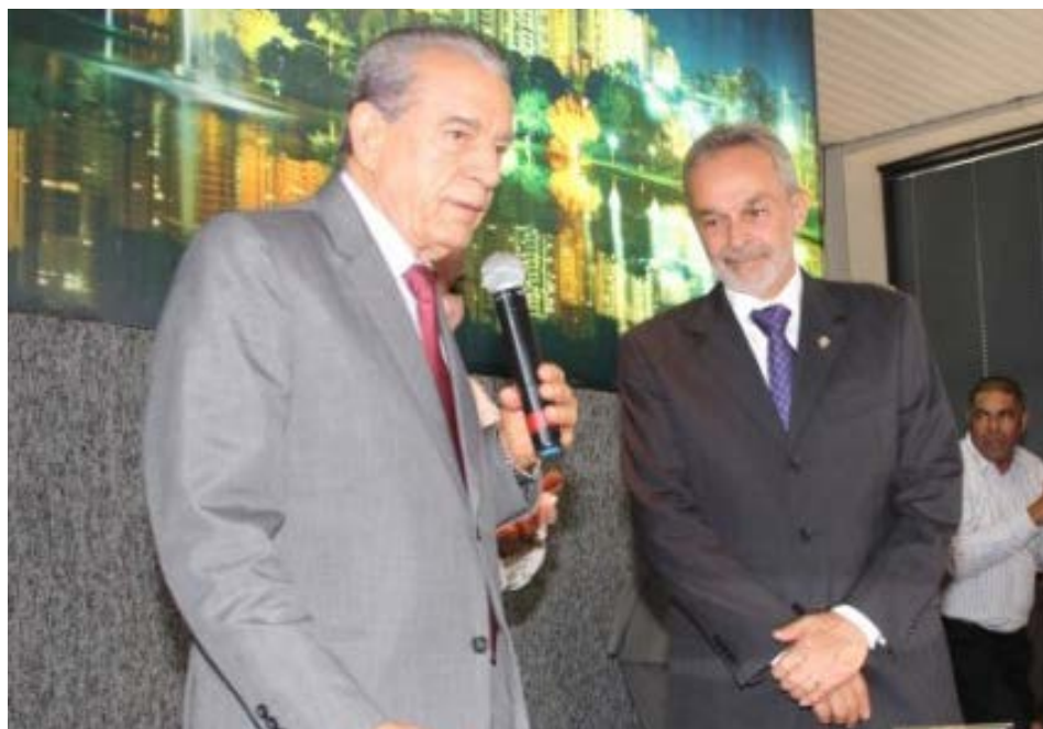
Prefeitura de Goiânia

O prefeito de Goiânia, Iris Rezende, nomeou na terça-feira (10), o novo titular da Secretaria Municipal de Governo (Segov). O nome escolhido é Paulo Ortegá, que também ocupa o cargo de Chefe de Gabinete.