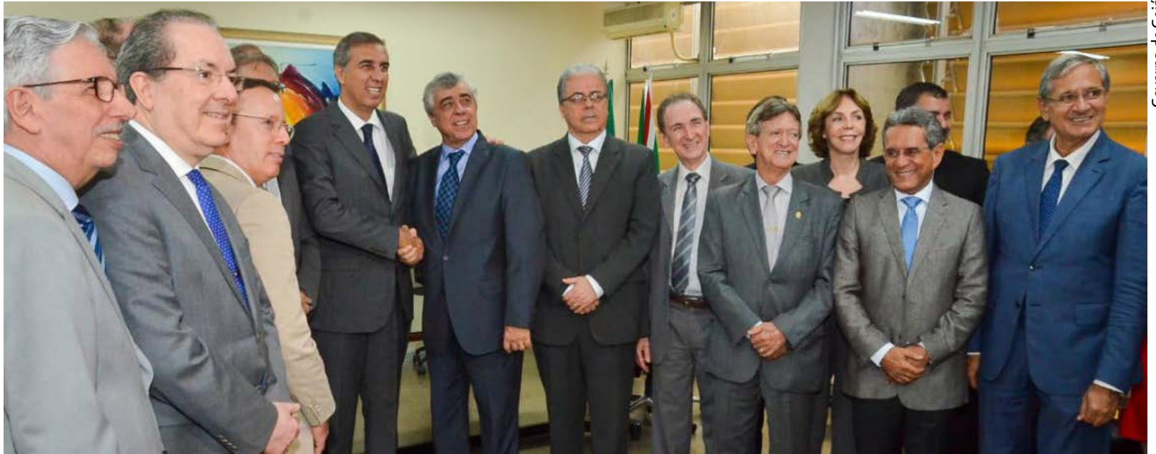
Governo de Goiás

“Faço isso com muito mais alegria do que um gesto litúrgico. Fiz questão de, no primeiro dia de trabalho, vir reconhecer a