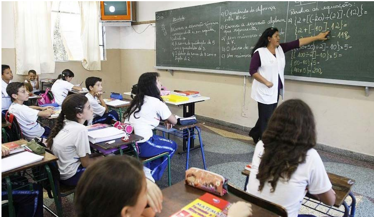
Governo de Goiás

As imunizações serão realizadas das 8h às 17h e os interessados devem se dirigir às unidades de saúde portando cartão de vacinação e documento de identificação. Professores devem apresentar também documento que comprove vínculo ou categoria profissional, como contracheque, crachá, entre outros.